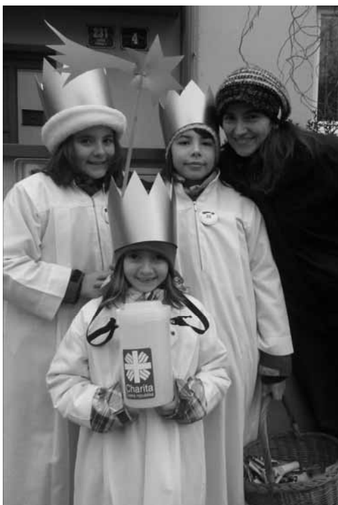
Tříkrálová sbírka marností nebyla, vzkazují Tůmovi