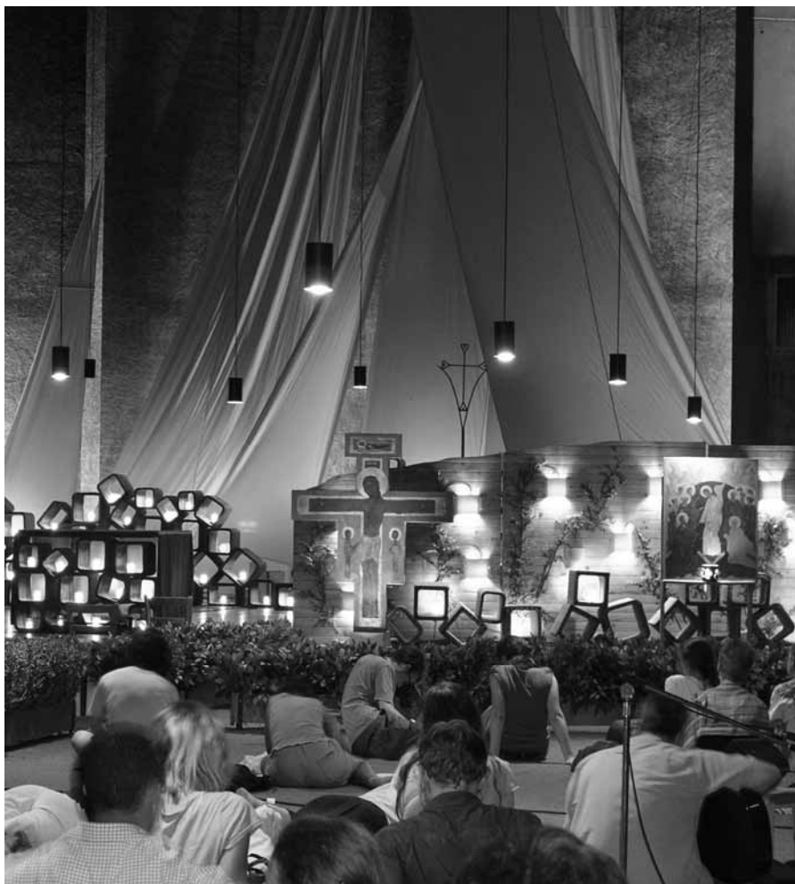
Společná modlitba v Chrámu smíření v Taizé

Od konce padesátých let dvacátého století přichází do Taizé mnoho tisíc mladých lidí z různých zemí a podílejí se na týdenních setkáních s modlitbami a rozjímáním. Mimo to bratři z Taizé navštěvují lidi v Africe, Severní i Jižní Americe, Asii a Evropě a organizují malá i velká setkání, která jsou součástí Pouti důvěry na zemi. Tuto pouť zahájil koncem sedmdesátých let bratr Roger. V listopadu loňského roku se uskutečnily Dny důvěry pro mladé lidi z celé České republiky v Praze. Byla to předzvěst celoevropského setkání, kterým bratři z Taizé spolu s mladými uvítají rok 2015. Česká republika se tak stane místem setkání již podruhé. Poprvé se u nás Pout' důvěry konala na přelomu let 1990/1991. (Více na www.taize.fr/cs ).