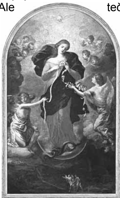
P. Maria rozvazující uzly Maria Knotenlöserin