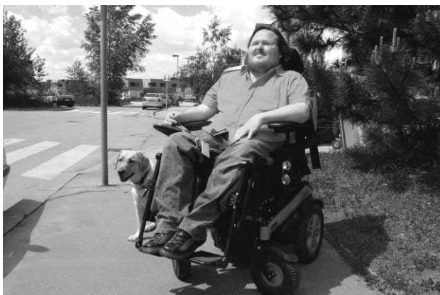
Jeden z našich klientů na procházce

Kontakt: 272 941 972; 737 322 569; e-mail: charita.chodov@email.cz