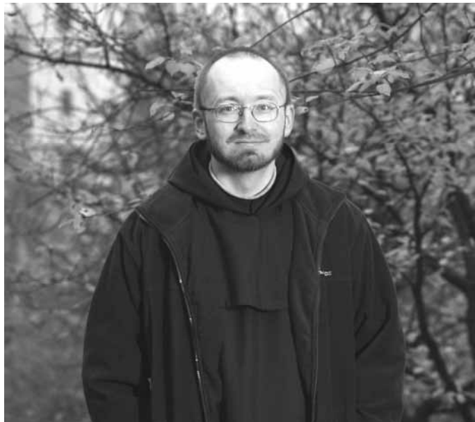
V klášterní zahradě

křížovou cestu s realistickými zastaveními, ale když vedu rozjímání, tak většinou tím způsobem, jak on ji vytvořil. On tady vlastně provedl to kázání.