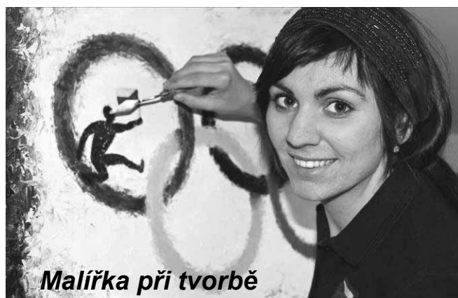
Malířka při tvorbě

Výstava v Mladotově domě ve Vikářské ulici č. 37 v Praze 1 bude otevřena až do 8. října, denně od 10 do 17 hodin a vstup je zdarma.