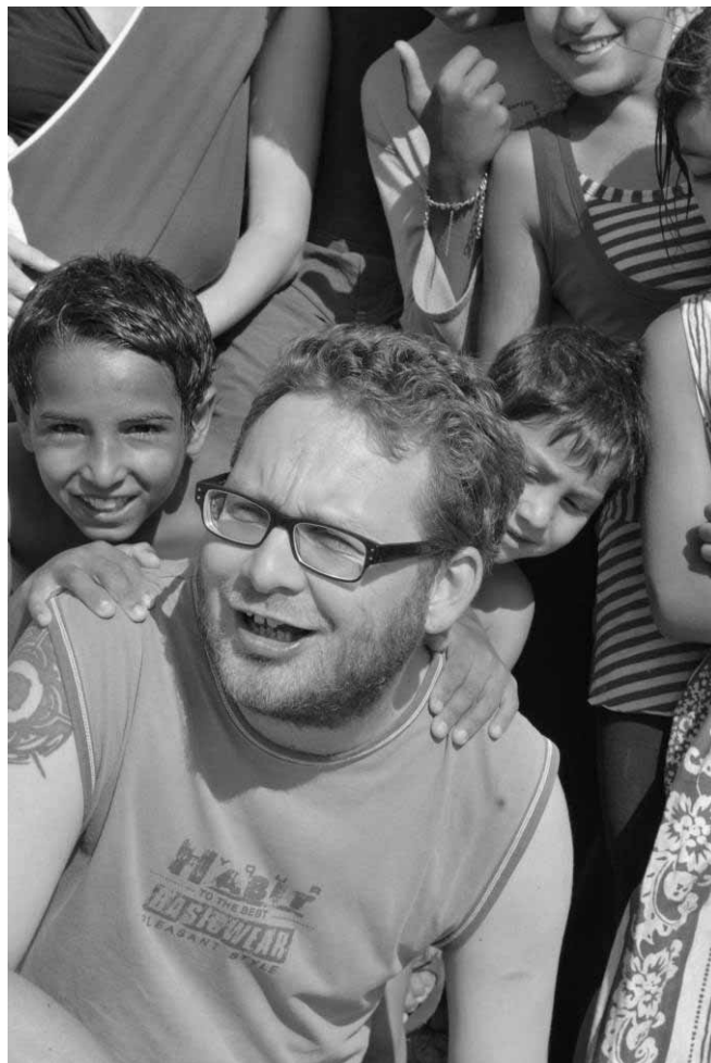
Tomáše to táhne k Romům

Rád za nimi jezdím na Slovensko. Zajímá mě, co má společného naše a jejich prožívání víry a vnímání Krista.