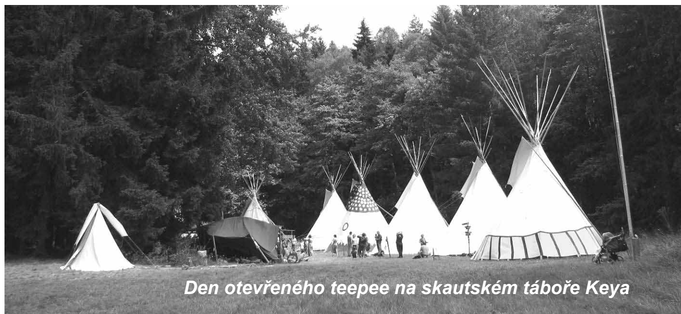
Den otevřeného teepee na skautském táboře Keya