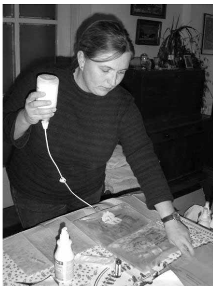
Příprava infuzního vaku

Kontakt: 272 941 972; 737 322 569; e-mail: charita.chodov@email.cz