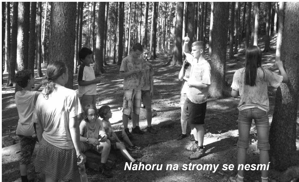
Nahoru na stromy se nesmí

ním místě nás provedla průvodkyně. Prohlédli jsme si kostel Nanebevzetí