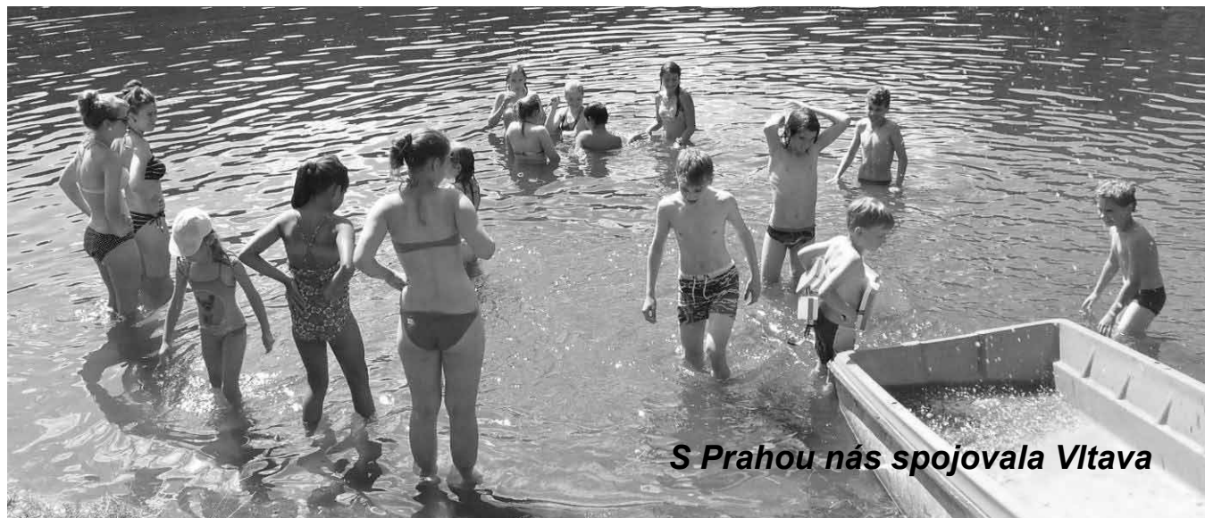
S Prahou nás spojovala Vltava