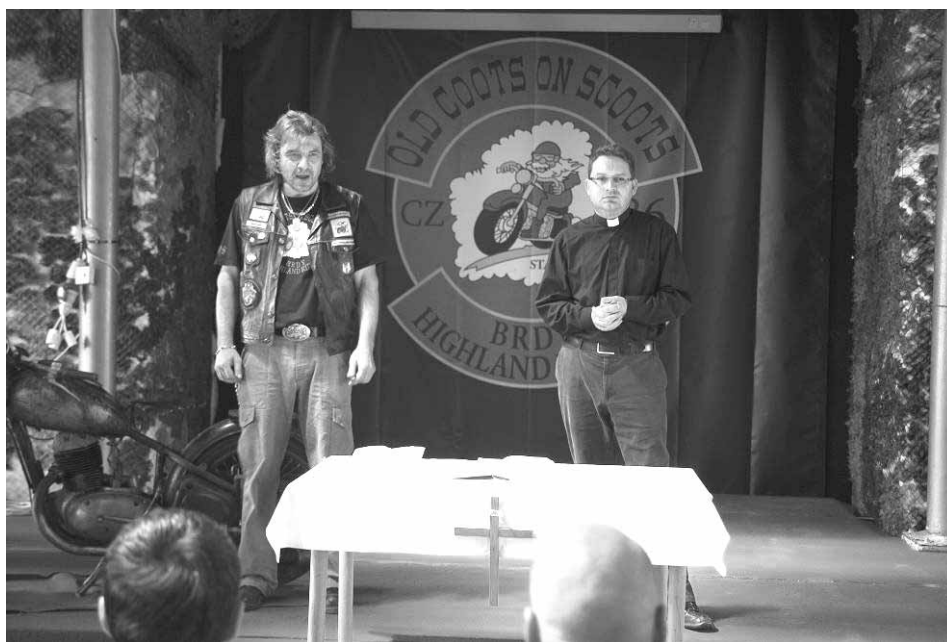
Rozloučení na dálku s otcem zakladatelem motorkářského gangu Old coots on scoots, Stará Huť 2011

ky právě u profesora Pospíšila na téma z oblasti filozofie náboženství – Rozumové poznání Boha. Mám za úkol zdokumentovat českého autora Cyrila Ježe, který vydal v roce 1923 publikaci Osobní Bůh a náboženství . Takže zpracovávám životopis a analyzuji jeho