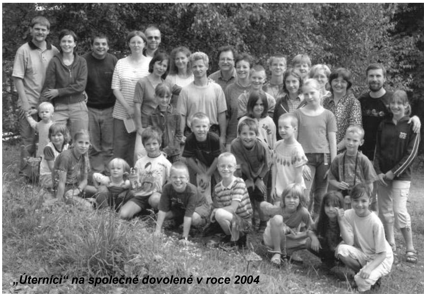
„Úterníci“ na společné dovolené v roce 2004