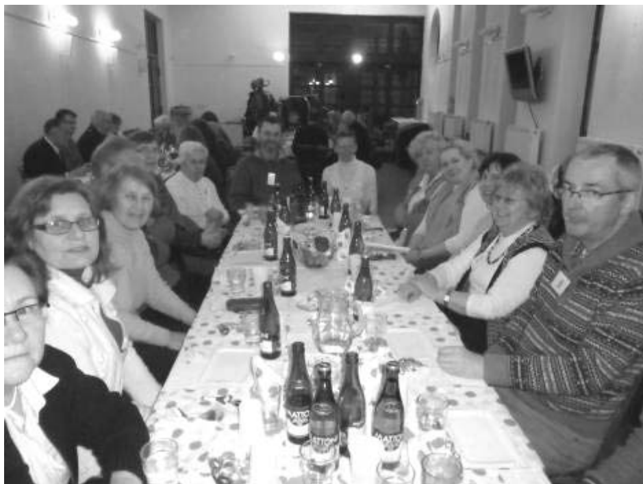
Nejcennější byla diskuse v malých skupinkách