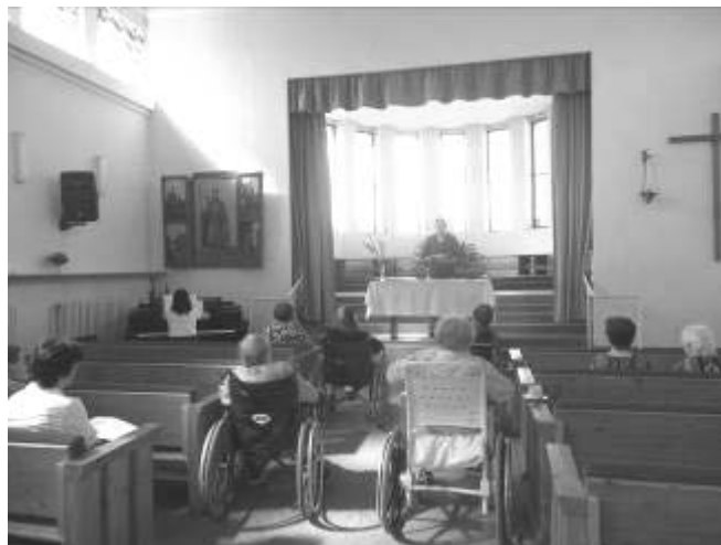
Ztišení v kapli sv. Václava v Krči