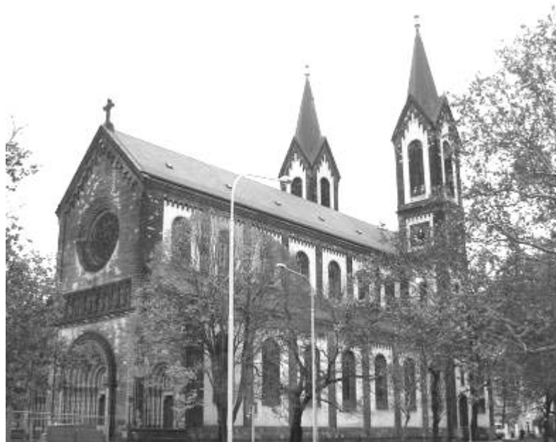
Kostel sv. Cyrila a Metoděje slaví 150 let