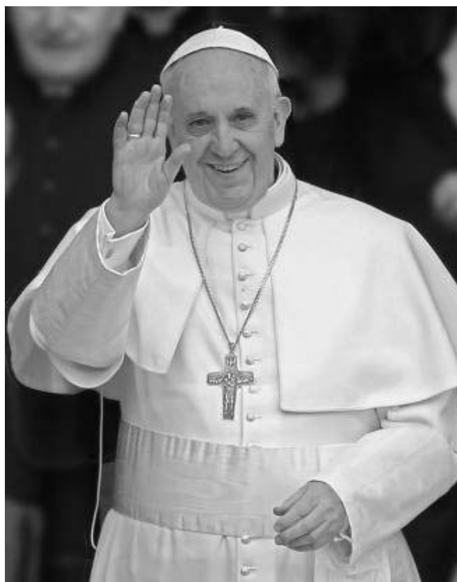
Habemus papam Francesco

A tak vstoupilo do mého srdce toto jméno: František z Assisi. Člověk chudoby, člověk pokoje, člověk, který má rád a chrání stvoření. V současné době máme vůči stvoření vztah ne právě dobrý, že? František je člověkem, který