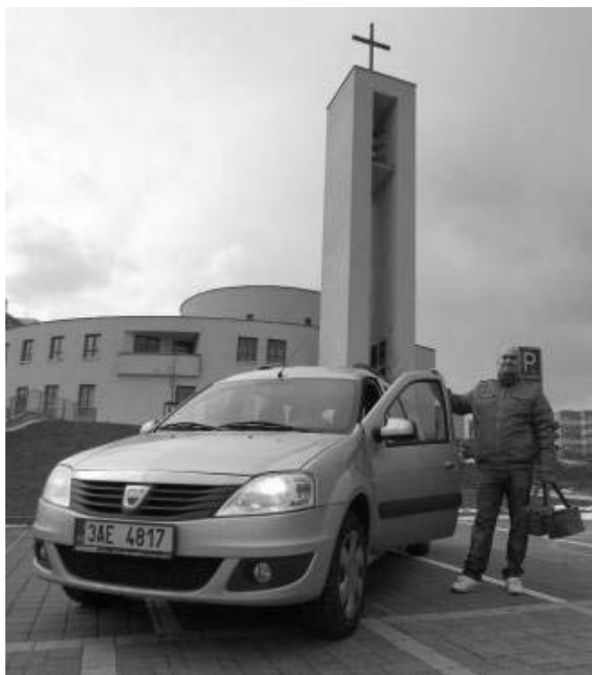
Pečovatel charity Chodov vyráží na rozvážku obědů

mocné pracovníky doplnily maminky s nemocnými dětmi. Přestože jsme povolali do služby i různé přátele na dohody o provedení práce, vedoucí pracovníci vzali batohy a také šli do terénu, zajistit všechny služby bylo téměř nemožné. Přitom máme v současné době nejvyšší počet klientů, co si pamatuji. Je jich celých 107. Ale to se tak ve službě prostě děje. Ideální by bylo, pokud by byl vyrovnaný stav mezi počtem zaměstnanců, klientů a množstvím dostupných finančních prostředků. Má zkušenost ale říká, že v tom trojúhelníku vždycky něco chybí. Buď máme zaměstnance a klienty, ale nemáme na ně peníze.