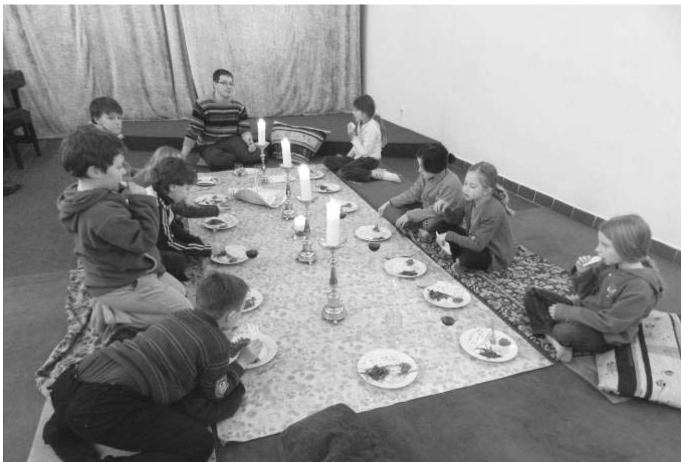
V rámci přípravy na první sv. přijímání děti prožily i židovský pesach