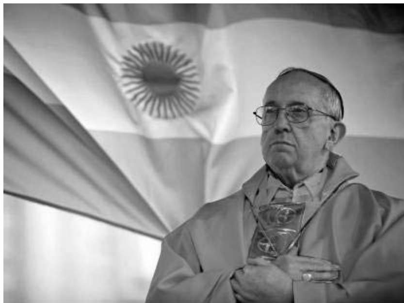
Kardinál Jorge Mario Bergoglio je prvním papežem neevropského původu, pochází z Argentiny

Italové papeže přijali jako svého, možná i proto, že pochází z rodiny italského přistěhovalce. Narodil se 17. prosince 1936 v Buenos Aires a má ještě čtyři sourozence. Rodina byla chudá, otec pracoval jako dělník na dráze a matka zůstala s pěti dětmi v domácnosti. Nejprve vystudoval chemicko-průmyslovou střední školu v Buenos Aires. Jako dospívající absolvoval závažnou operaci, kvůli infekci