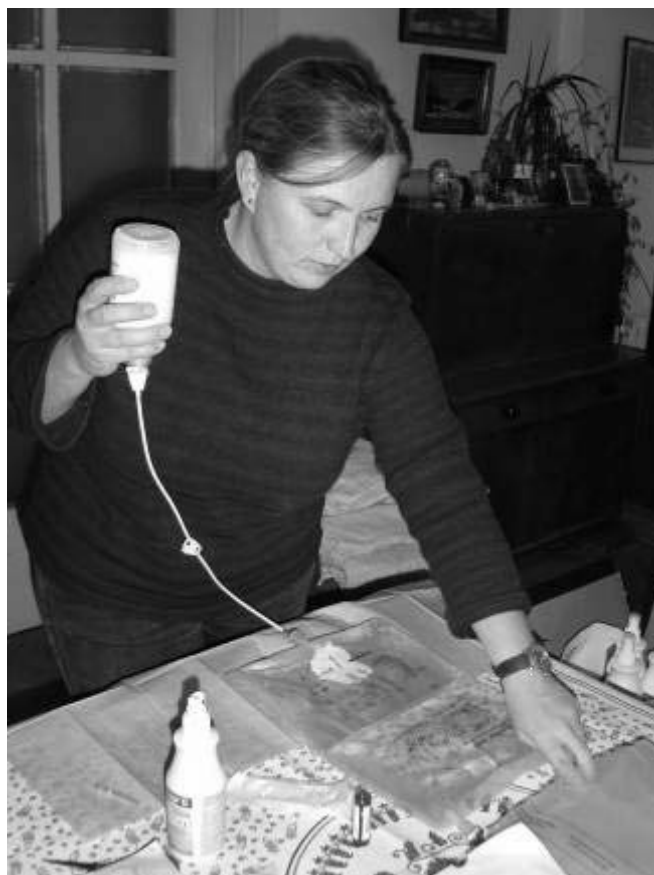
Zdravotní sestra připravuje vak s parenterální výživou

tkávám a mám radost, že jsou oba zdraví, spokojení a spolu.