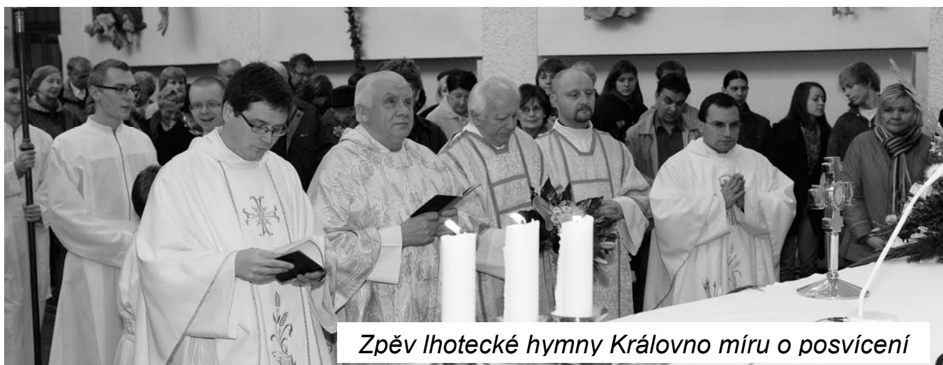
Zpěv lhotecké hymny Královno míru o posvícení