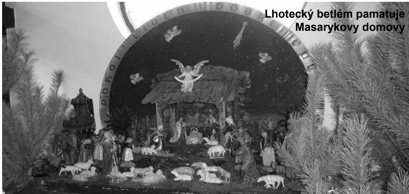
Lhotecký betlém pamatuje Masarykovy domovy

Johannes Scheffer (1624–1677), básnickým jménem Angelus Silesius psal své dílo Cherubský poutník v době třicetileté války, kdy rozpad všech vnějších jistot, příval bídy a utrpení vedl citlivé a přemýšlivé duše zpět k základním otázkám života. Jedná se o jednu z vrcholných památek křesťanské mystiky. Vybíráme několik ukázek s vánoční tematikou.