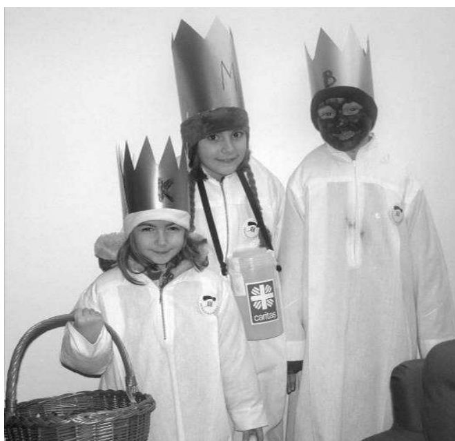
Malí koledníci ze Lhotky

Vyrážíme, s velkým nadšením děti vybíhají na ulici samy, jen co jsou dostrojeny, a již zvoní u sousedů, aniž by počkaly na dospělé. Postupně nacvičujeme choreografii. Seskupit se u branky, nezpívat hned po zazvonění, ale až se někdo objeví. Nezvonit jako na lesy, nevstupovat na pozemek bez vyzvání, koledu nekřičet, ale zpívat. Nekomentovat obdržení finanční obnos, ani kladně ani záporně. Výkřiky, že takhle málo nám ještě nikdo nedal, opravdu nejsou na místě. Nahlas za všechno poděkovat. Nejevit zklamání, pokud nedostaneme sladkosti. Kalendářik a cukr nenabízet se slovy - „tady máš“ ..., ale „přinesli jsme Vám...“