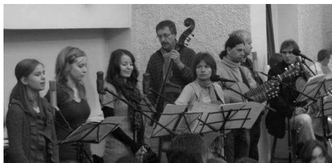
Kapela z vánoční mše pro děti