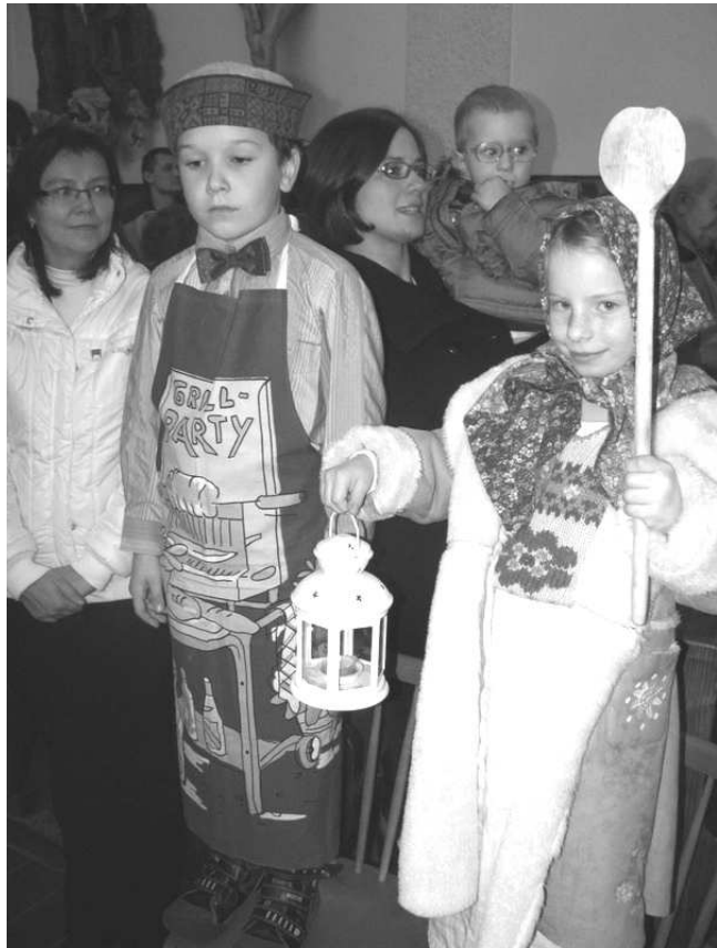
Scénka z vánoční mše pro děti

Milí farníci! Dostáváte do rukou první číslo letošního Věstníku. Má sice nový kabát, ale hlásí se a navazuje na letitou tradici předchozích ročníků. Více podrobností o úpravách najdete na straně 15. Děkuji redaktorům i autorům článků. Mezi nimi jsou i vaše reflexe doby vánoční.