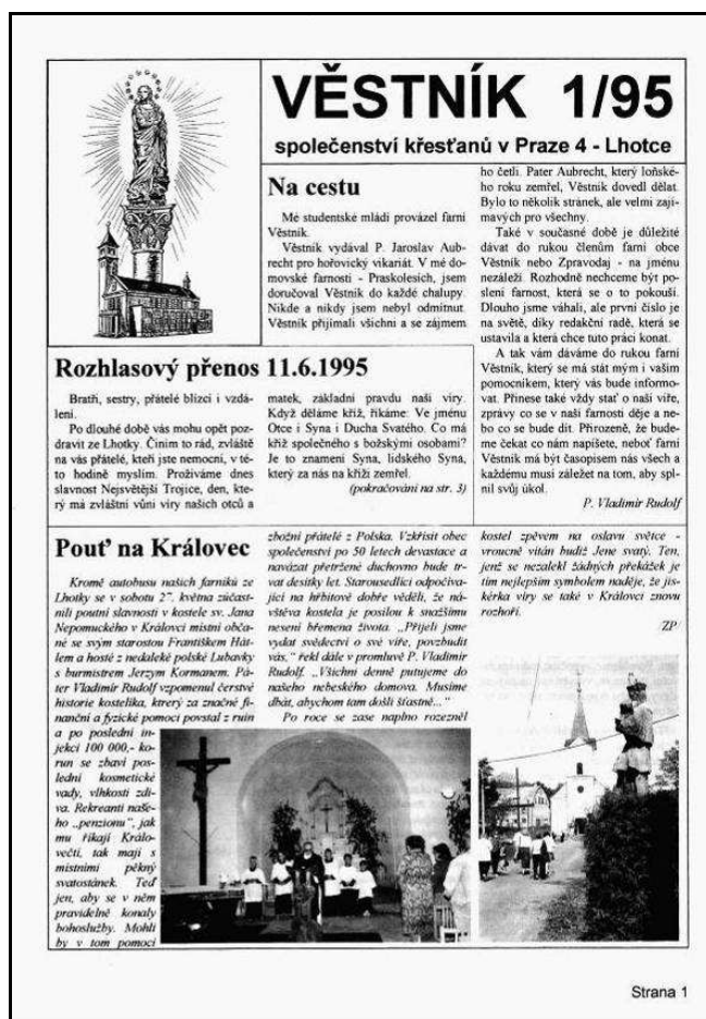
Obálka prvního čísla Věstníku

na Lhotce vycházet v květnu roku 1995. Jako logo byl použit obrázek z pamětního listu Lhotky z roku 1940, na kterém byl vyobrazen kostel s mariánským sloupem, což přesně vyjadřovalo smysl vzniku kostela. Redaktorem