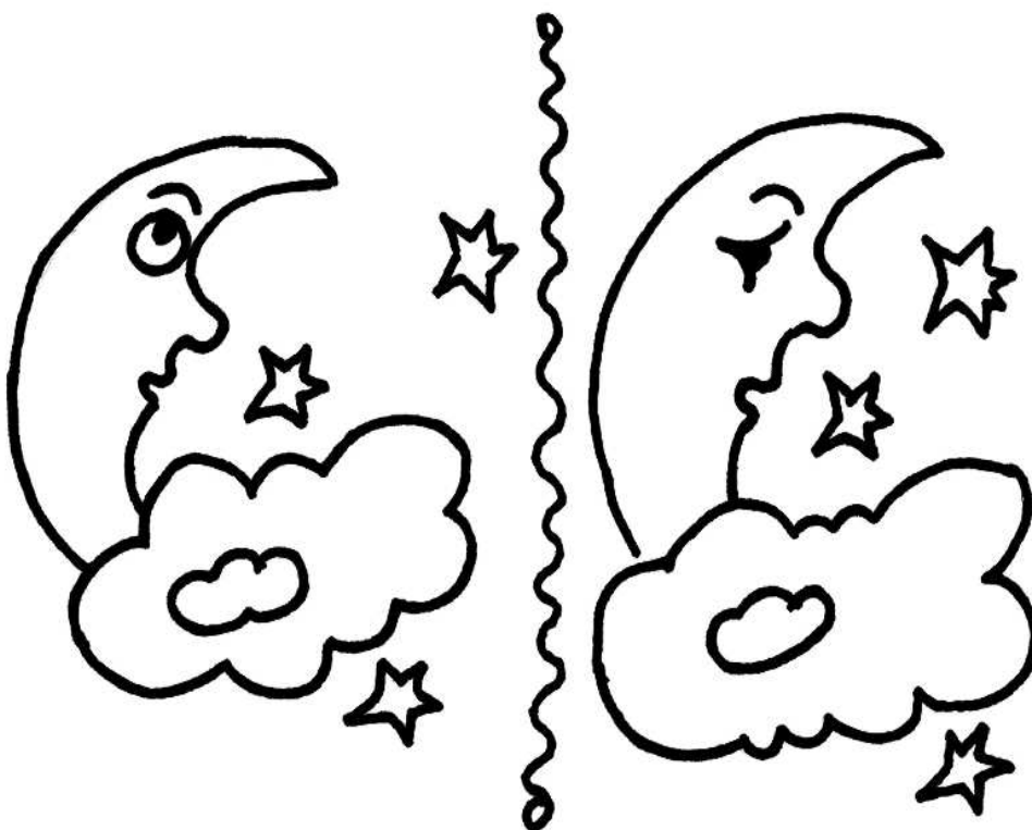
Poznáte, děti, pět rozdílů?

Přeji vám krásné dny. Váš Kri..., Kri..., no přeci KRISTIÁN