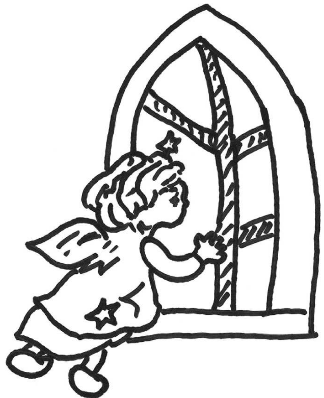
Na okno kostela ťuká malý andělíček.