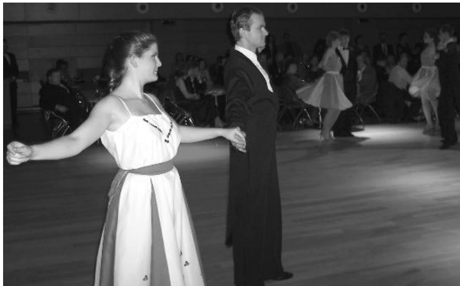
Předtančení Tanečního klubu Tango na farním plesu