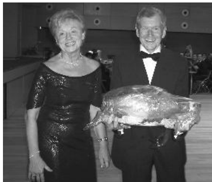
Výherci hlavní ceny v tombole – jedenáctikilogramové vepřové kýty