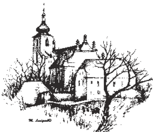
Kostel sv. Petra a Pavla v Kralovicích

A připravované partnerství s farností žijící ve skromnějších podmínkách je výrazem toho, že si tuto odpovědnost uvědomujeme. A krom toho: proč by měla být solidarita v církvi praktikována jen napříč hranicemi či kontinenty? I v naší zemi jsou různé bohaté farnosti i diecéze a povinností silnějších je postarat se o slabší. Dojde-li jednou k odluce státu a církve, budeme se jako církve tak jako tak muset postarat i sami o sebe.