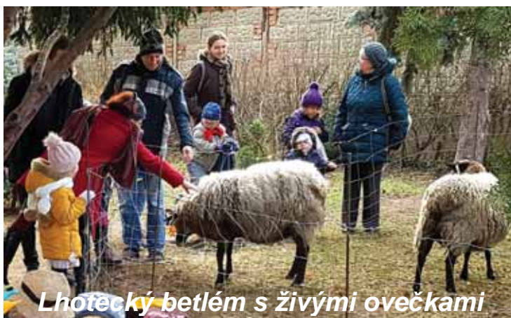
Lhotecký betlém s živými ovečkami