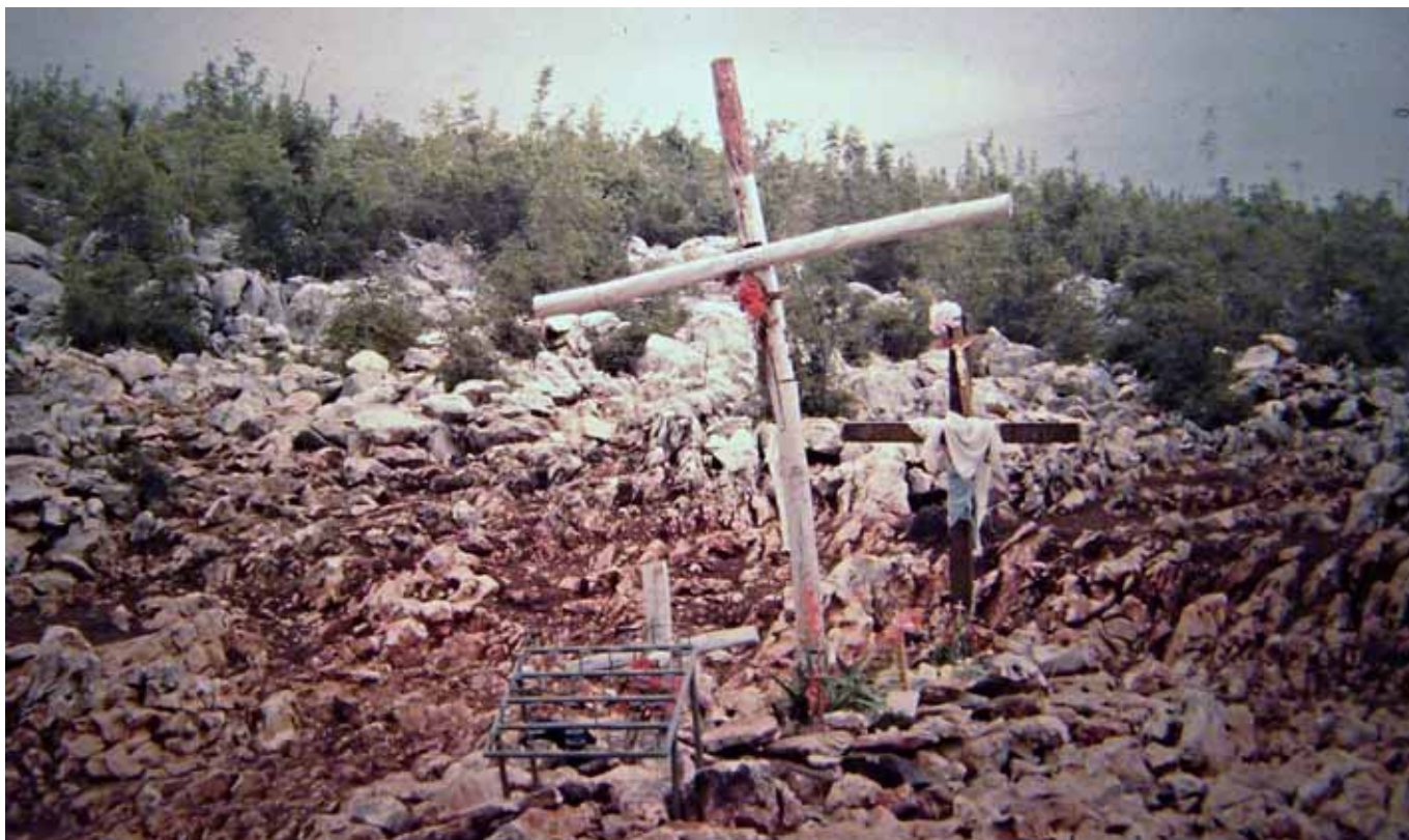
Medžugorje v r. 1984 bylo ještě bez davů poutníků

ale informace, že je nové místo zjevení P. Marie v Medžugorje, kde ještě na jaře 1984 P. Marie promlouvala k vizionářům. Zda bychom se tam mohli zastavit.