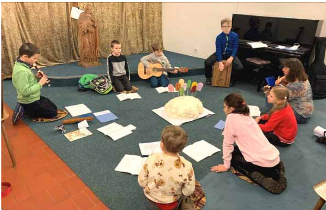
K první svátosti smíření a svatému přijímání se u nás připravuje 13 dětí. Zahrňme do modlitby také jejich rodiny.

Podrobný program včetně křížových cest naleznete také na nástěnce a farním webu www.lhoteckafarnost.cz .