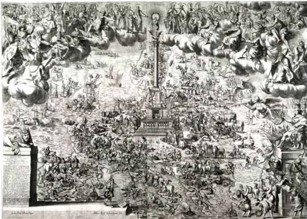
Mariánský sloup v Praze jako duchovní střed Evropy (1661, mědirytina, Autor Karel Škréta, rytec Melchior Küssel)