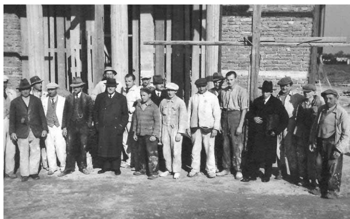
Stavební skupina dělníků pracujících na výstavbě kostela