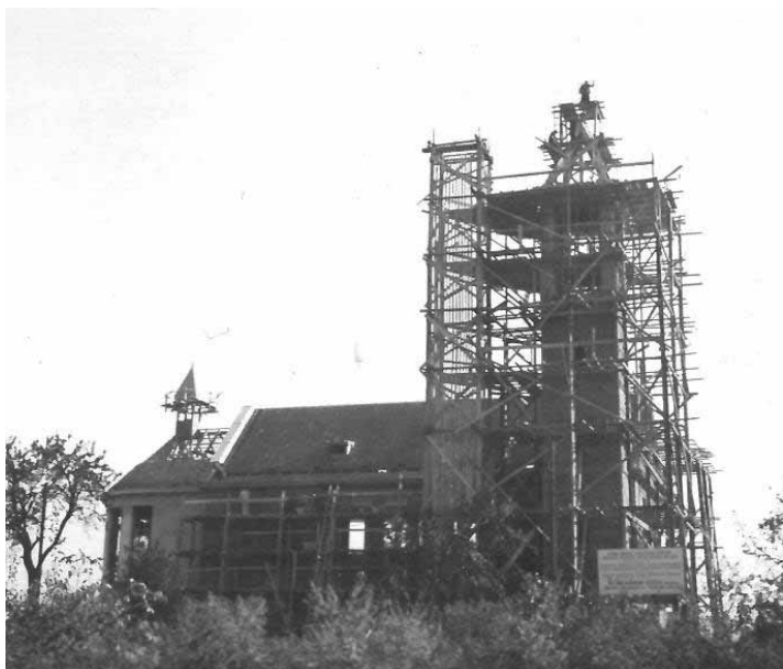
Dokončování hrubé stavby