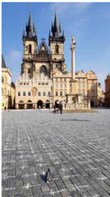
25 tisíc křížů na Staroměstském náměstí připomínaly oběti nemoci covid-19. Poučí se lidé?