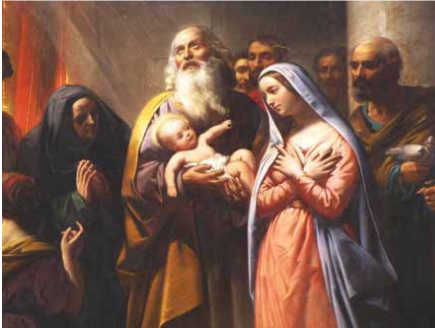
Svatý Josef ve stínu (vpravo). Obraz Obětování Páně z kostela sv. Petra a Pavla v Hochfeldenu v Alsasku, 19. stol.

Účelem tohoto apoštolského listu je vzrůst lásky k tomuto velkému světcí a pobídka, abychom prosili o jeho přímluvu a napodobovali jeho ctnosti a jeho rozlet.