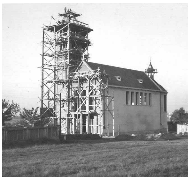
Kostel bez přístavby kláštera