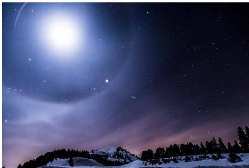
To světlo ve tmě svítí a tma je nepohltila. J 1,5