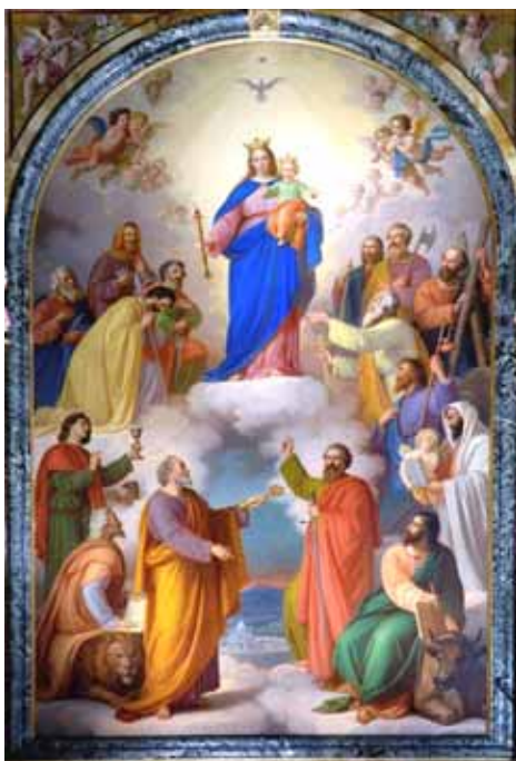
Obraz z turínské baziliky