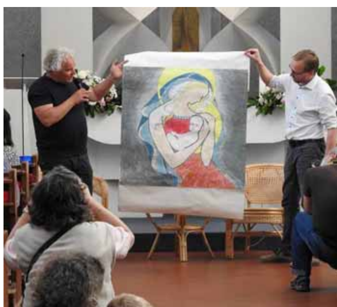
V rozhovoru došlo i na jeho návrh mozaiky pro Centrum Lhotka