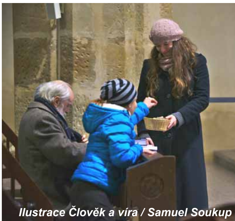
Ilustrace Člověk a víra / Samuel Soukup

Informace o bankovních spojení na farním webu nebo ve Věstníku č. 9/2018: www.lhoteckafarnost.cz/chci-prispet , www.lhoteckafarnost.cz/_d/01/Vestnik201809.pdf#page=7 .