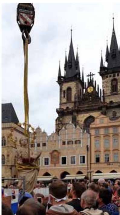
Nová historie mariánského sloupu

Přípravy, které předcházely jeho realizaci, jsou jako dlouhé litanie, se stále se opakujícím refrénem: podáno – zamítnuto atd. Byly to samozřejmě i přípravy materiálu v různých zemích, hodiny a hodiny práce mistra sochaře a jeho pomocníků v dílně aj. O tom by mohli dlouze vyprávět ti, kteří se toho zúčastnili nebo to zblízka sledovali a podporovali. Výsledek ovšem stojí za to.