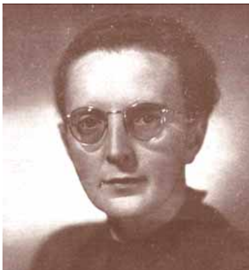
Jarmila Glazarová