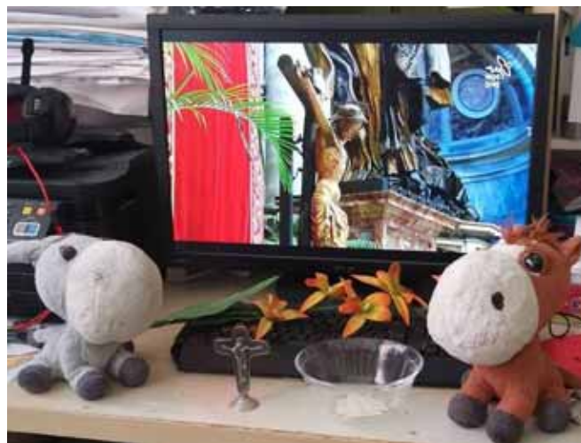
Domácí „oltář“ v karanténě