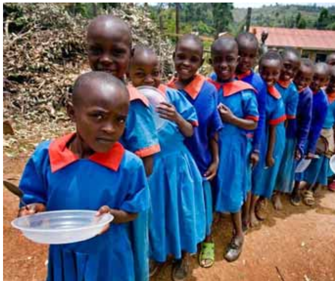
Děti z Keni čekají na jídlo

Chvála Kristu, chci vám ještě jednou srdečně poděkovat za možnost přijít do vaší farnosti na farní kafe a všem farníkům za velkou otevřenost, krásné