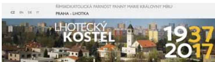
Farní web lhoteckafarnost.cz