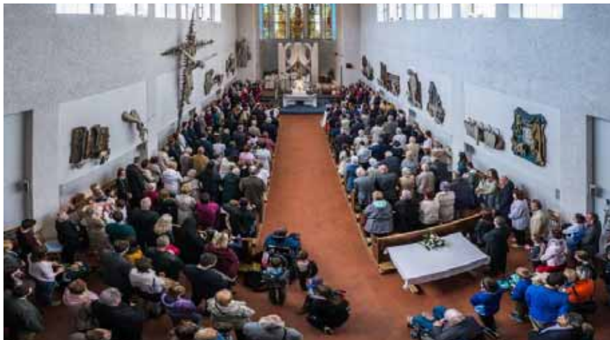
Dobrá farnost je živá farnost

světa člověk najde tutéž liturgii, může přijmout tutéž eucharistii. Projevy zbožnosti se však liší a člověk chtě nechtě srovnává s tím, co zná z domova.