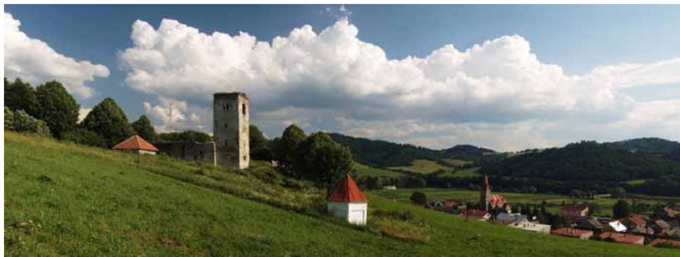
Kostelík byl loni vyhlášen za národní kulturní památku Slovenska.