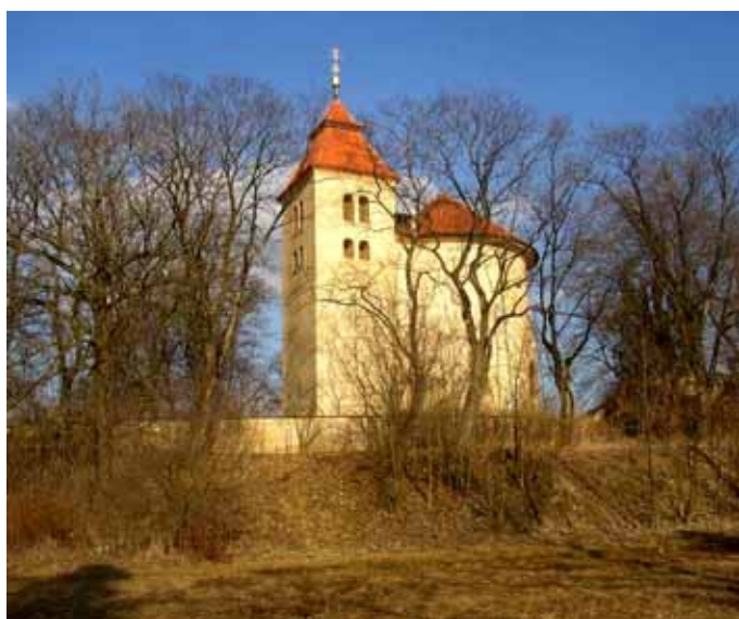
Kostel svatých Petra a Pavla na Budči

Srdečně zveme na procházku jarní krajinou s naším panem kaplanem.