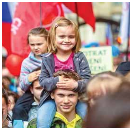
(jš) Foto z pochodu pro život 2019