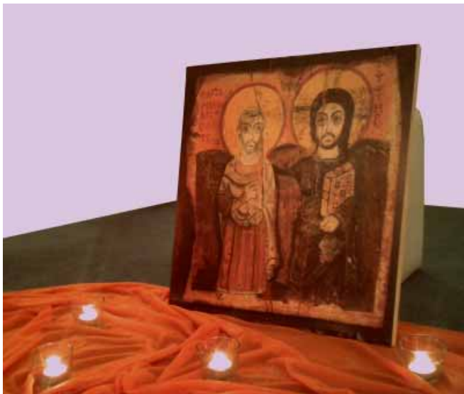
Ikona přátelství se používá při ekumenické modlitbě Taizé

úryvek ze Skutků apoštolů o tom, jak se Pavel kvůli ztroskotání lodi, která ho vezla na výslech k císaři, dostal na Maltu a mohl tam místním obyvatelům, kteří jej pohostinně přijali, hlásat evangelium. Úryvek k bohoslužbě vybrali pro tuto příležitost právě křesťané z Malty. Možná s vděčností za to, že díky cizincům, kteří ztroskotali u jejich břehů, mohli uslyšet radostnou zvěst. Možná proto, že téma pohostinnosti vůči ztroskotancům, kteří za nimi