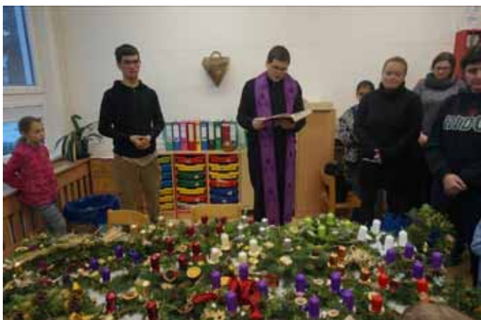
Žehnání adventních věnců

CMŠ Studánka a Spolek rodičů Studánka srdečně zvou všechny zájemce na tradiční adventní dílnu, která se uskuteční ve školce (Ke Kamýku 686) v sobotu 30. 11. 2019 od 14 hodin. Můžete si zde vytvořit adventní vě-