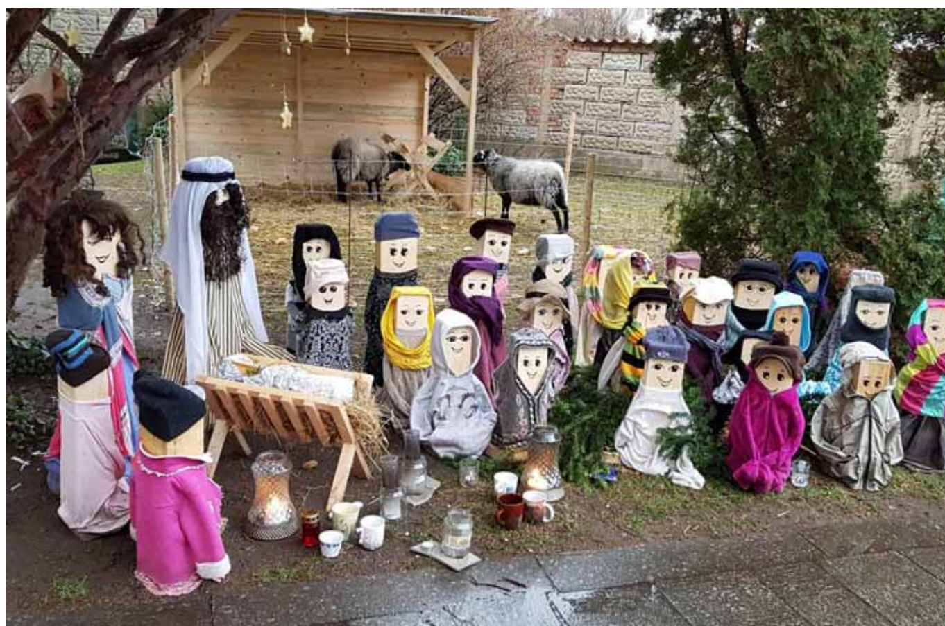
Venkovní betlém letos doplní živé ovečky od 22. do 29. 12. 2019