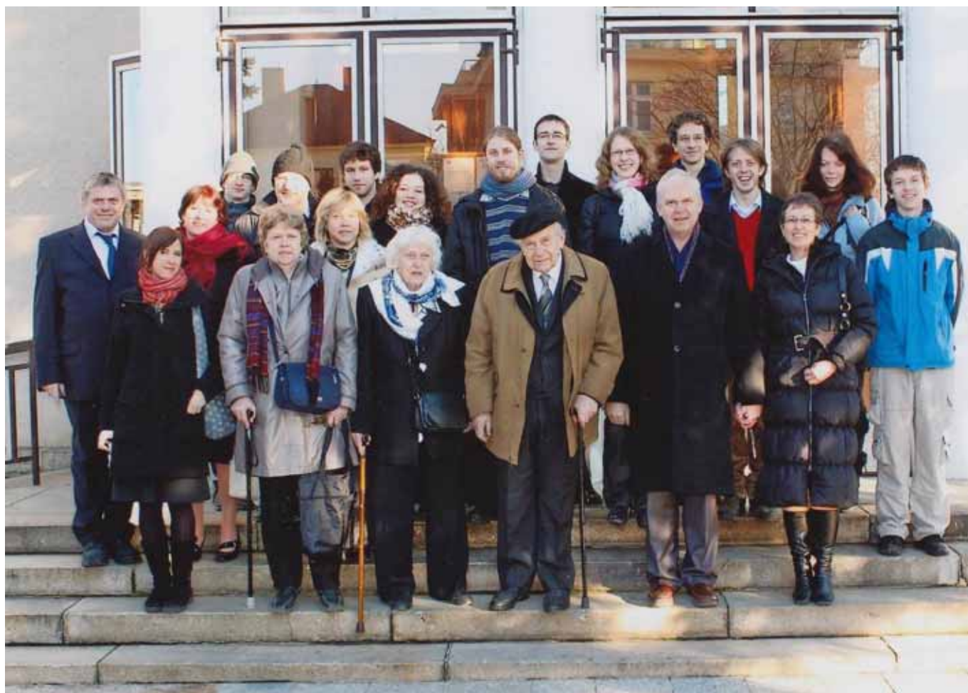
S rodinou při diamantové svatbě, Lhotka 26. 12. 2009

Od počátku 50. let se řada schůzek pražské „Rodiny“ konala v pražském