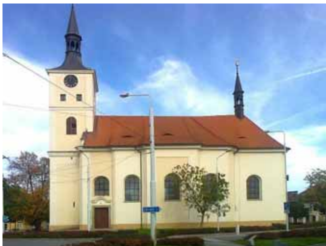
Farní kostel sv. Maří Magdalény v Lázních Bohdaneč