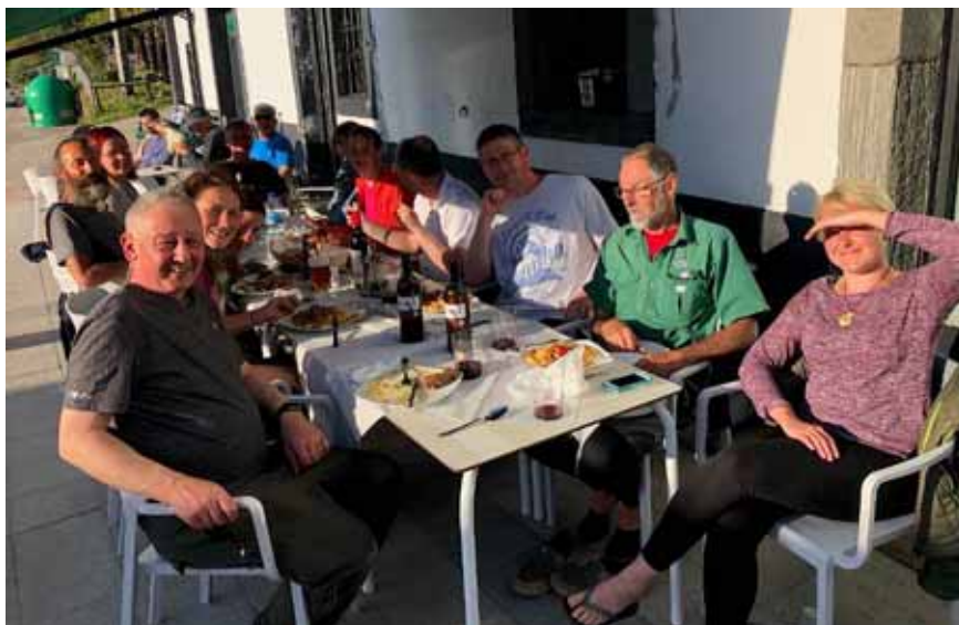
Večery tráví peregrinos v tzv. albergues, útulnách. Víno je ve Španělsku výborné a levné.

Camino jde každý sám za sebe. Přesto se na cestě potkáte se spoustou zajímavých lidí. Škála typů je skutečně široká – od bývalého námořníka bojujícího s alkoholem přes dělníka, který neumí ani slovo jinak než polsky, až po vysoké manažery, kteří hledají osvěžení ducha. Někteří, jak se zdá, se na cestu dokonce vydají hlavně kvůli těmto zajímavým kontaktům. Jiným jde zase o sportovní výkon. Tady je dobré poznamenat, že ne všichni, které jsme potkali, pouť dokončili. A ne u všech proběhla viditelná změna. Můžu ale říct, aniž bych prozrazoval něco příliš osobního, že hlubokých rozhovorů o životě jsem tam zažil dost. U mnohých šlo skutečně o ten moment revize svého dosavadního života, některé rozhovory končily v slzách. Camino vás prostě „dostane“. Nebo spíš otevře.