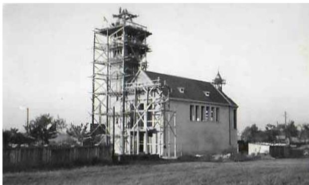
Výstavba lhoteckého kostela

Kostel se stavěl v „předvečer“ hrozby druhé světové války. Byl postaven za půl roku. Během války zde lidé stále prosili P. Marii Královnu míru o pomoc. Nyní je naše farnost v situaci, kdy je potřeba provést rekonstrukci kostela a zvětšit prostory