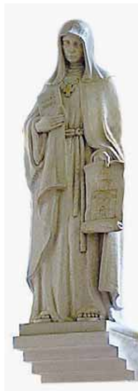
Foto: Socha sv. Anežky České od Karly Vobišové v kostele sv. Anežky na Spořilově