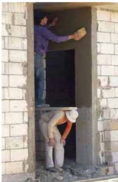
Není legrační, jak se tu „pinožíme“?

P.S. Že se těším do nebe alespoň v mém případě ještě neznamená, že se těším na smrt ☺