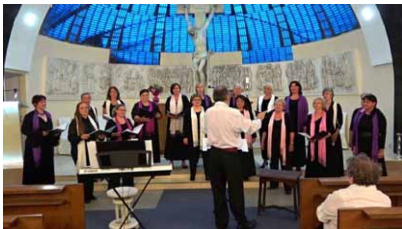
Amicitia. Jarní benefiční koncert 2018

Viz https://www.ceskesbory.cz/01-01-clanek.php?id=2751 (red.)