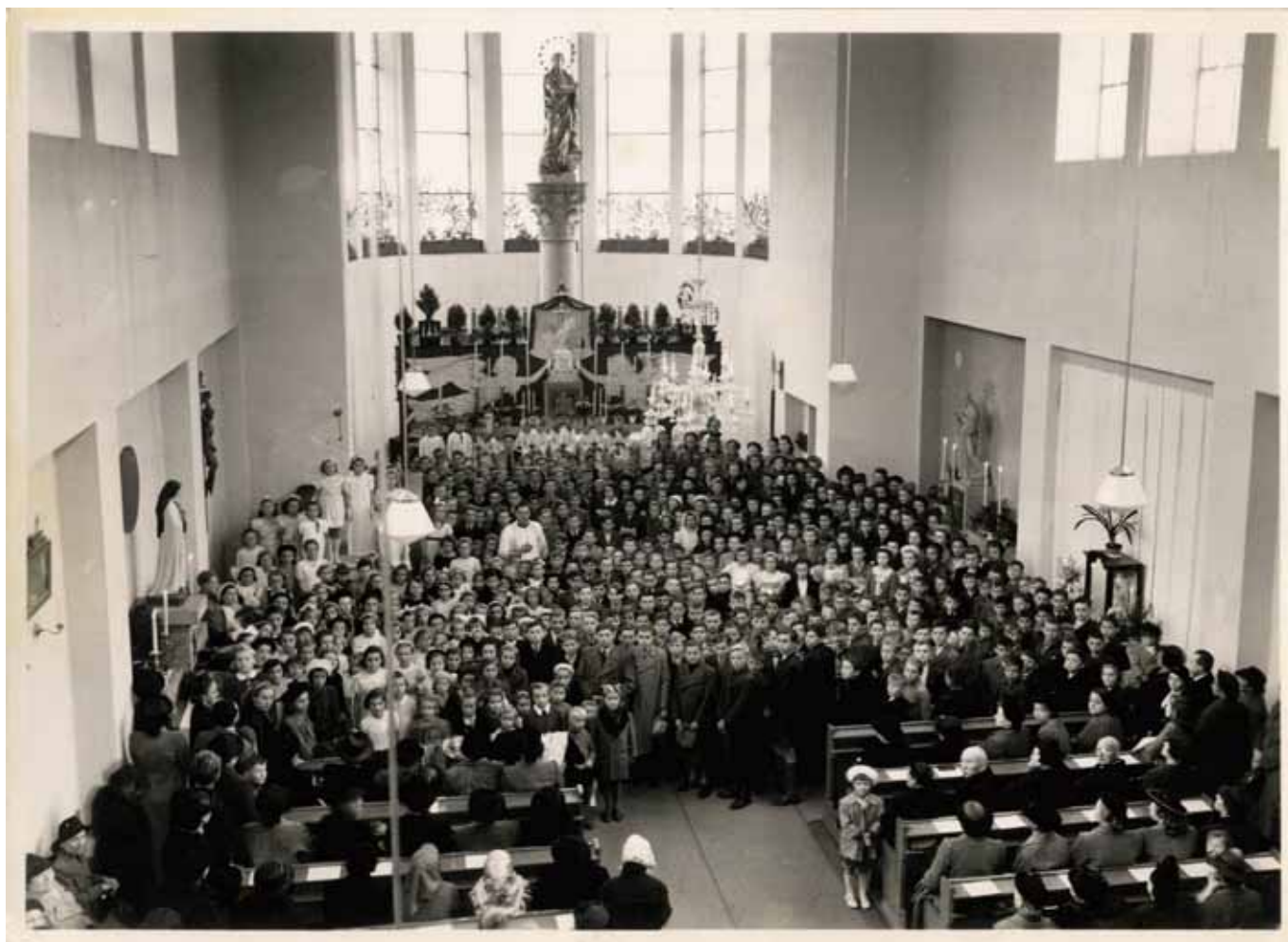
Při májové slavnosti 26. května 1940 zpívaly a recitovaly básně děti ze škol v Modřanech, Hodkovičkách a ze Lhotky-Tempo.