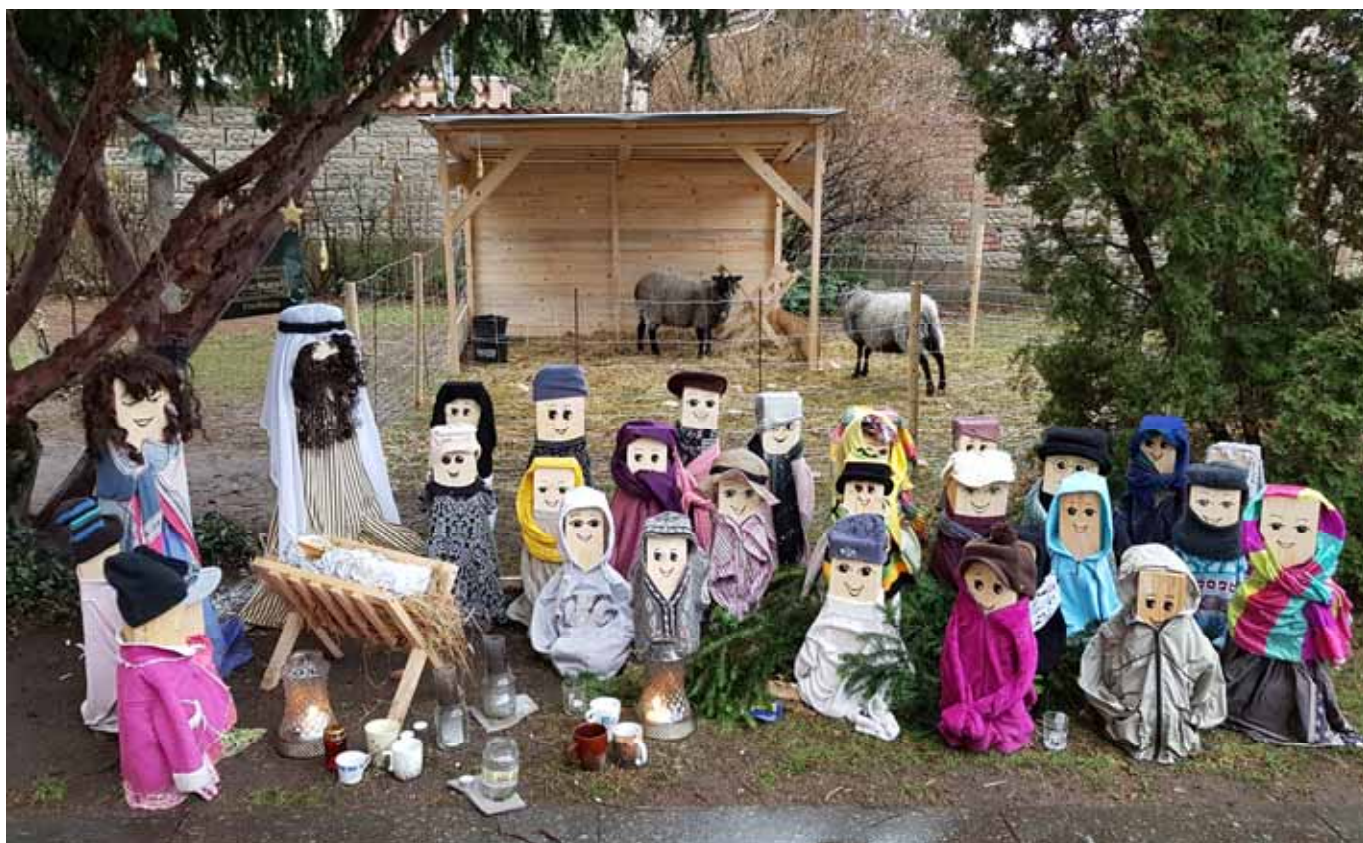
Lhotecký venkovní betlém tentokrát s živými ovce.