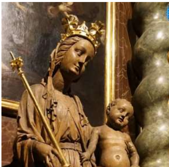
Na svou dobu neobvyklý výraz v Mariině tváři vyjadřuje předzvěst budoucího utrpení