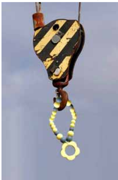
Nikdy jsem nic takového nenosila