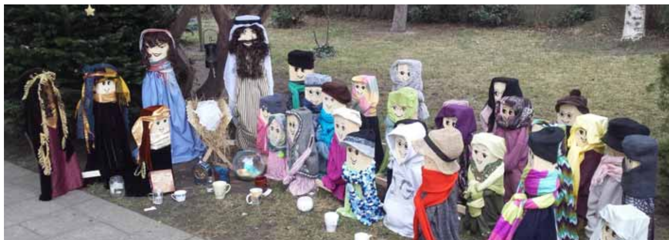
Venkovní betlém letos doplní živé ovečky od 23. do 26. 12.

Kasičky u betlémů – černoušek a an- děl – jsou každoročně určeny na misijní účely. Farnost např. opět podpoří in- dickeho chlapce Prabhu částkou 4 900 korun. Své příspěvky na podporu indic- keho chlapce můžete také přinést do sakristie.