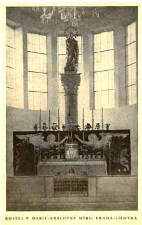
KOSTEL P. MARIE-KRÁLOVNY MÍRU, PRAHA-LHOTKA

v novém roce a vděčně zaplať Pán Bůh za laskavě věnovaný dar v roce 1938 všem svým šlechetným příznivcům a dobrodincům upřímně přeje Spolek pro udržování římskokatolických bohoslužeb a výstavbu kaple v Praze – Lhotce.