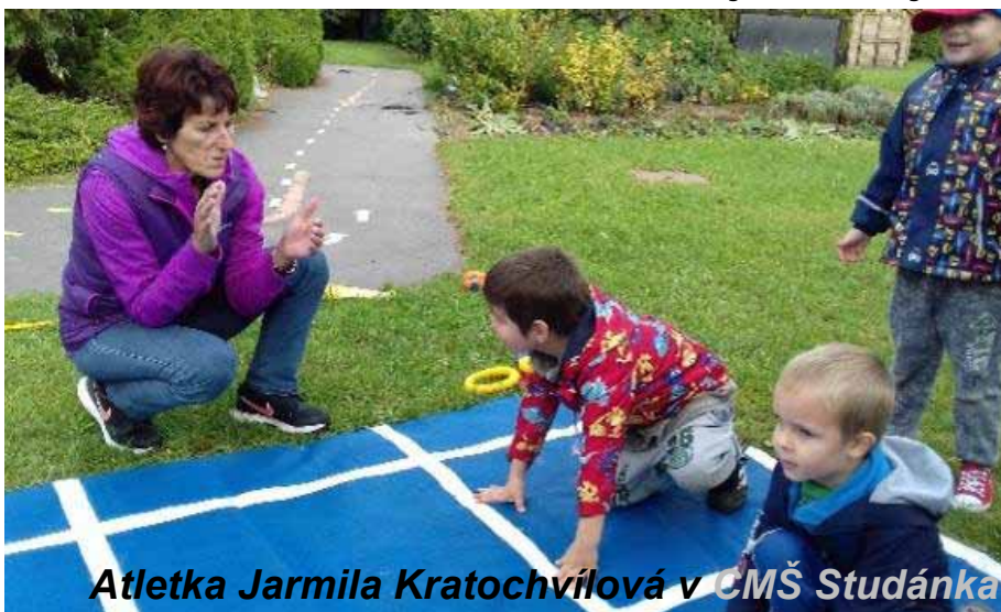
Atletka Jarmila Kratochvílová v CMŠ Studánka