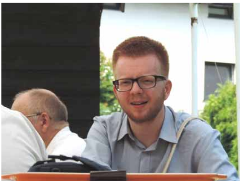
Foto ze Zahradní slavnosti 2016

Jenže během prvního roku studia se ve mně na základě jednoho rozhovoru hnulo to povolání, které ve mně bylo už dlouho přítomné, a já jsem si podal přihlášku. To, že jsem musel opustit studium literatury a možnost stát se literárním historikem nebo teoretikem je pro mě jedna z největších obětí, kterou jsem svému povolání musel přinést.