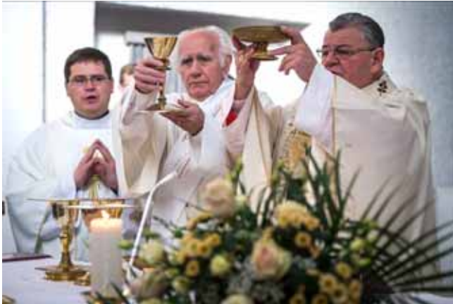
S kardinálem Dominikem Dukou