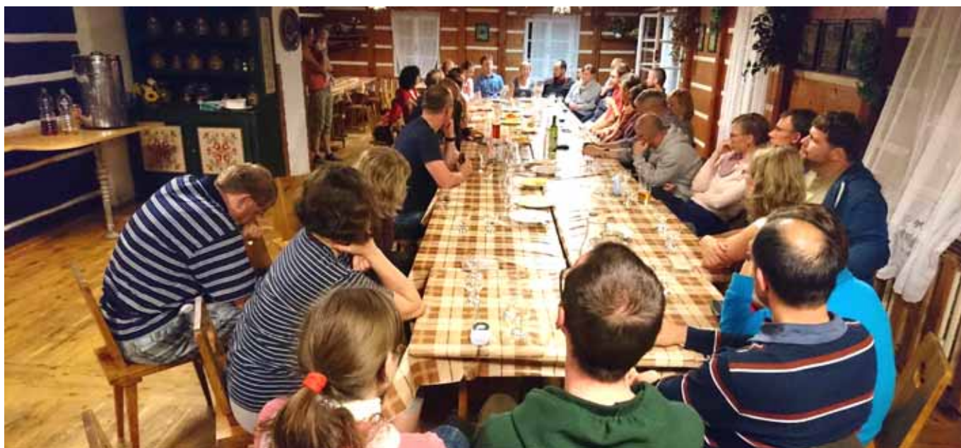
Účastníci manželské obnovy ve Sněžném v Orlických horách