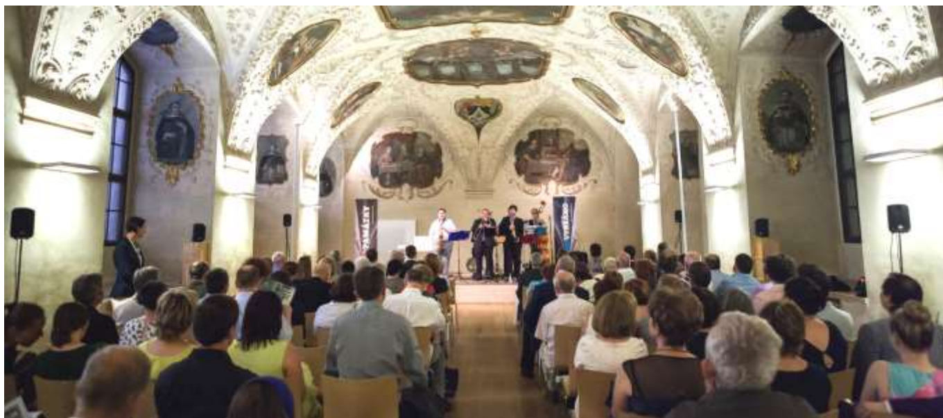
Refektář dominikánského kláštera

Tuto soutěž veřejnosti každoročně vyhlašuje Institut pro památky a kulturu, o.p.s. Husova 8/234, 110 00 Praha 1 a letos běžela od 20. 4. do 20. 5. My jsme ale ani o Institutu ani o této soutěži vůbec nevěděli. V pondělí 7. 5. 2018 ji náhodou našla Jana Šilhavá a zjistila, že jsme s naší veřejnou sbírkou na rekonstrukci kostela do soutěže zařazeni.