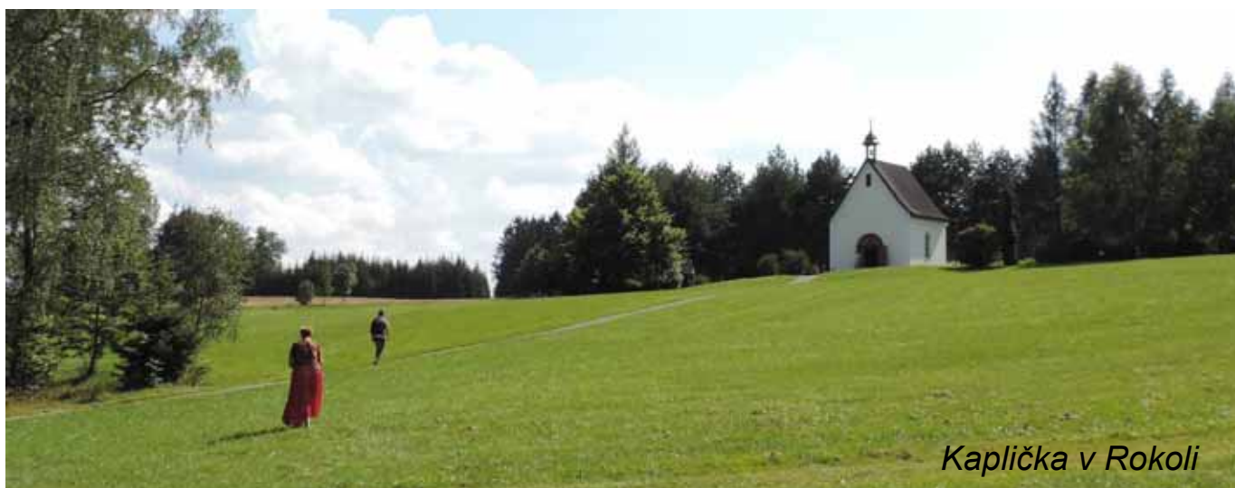
Kaplička v Rokoli