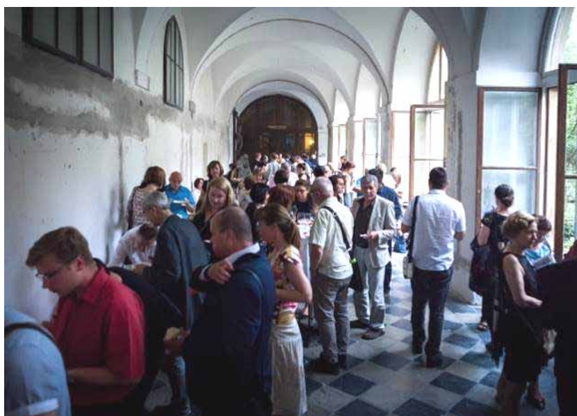
Občerstvení v ambitech