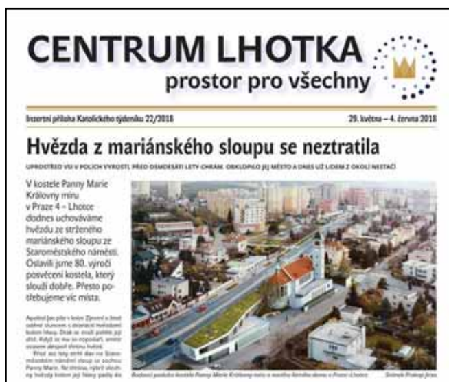
Příloha Katolického týdeníku č. 22

Když se v dubnu začal hlásit termín, kdosi mi připomněl mou koordinační roli, a taky jsem začala sbírat příspěvky. A už to začalo. Chybějí vhodné fotografie. Jaké tam vůbec chceme mít? Půlka jich je nekvalitní, jiné tam nemůžeme dát kvůli ochraně osobních údajů. Obsahy článků se nám kryjí. Nepůsobí výčty našich aktivit chvástavě? Máme publikovat fotky dezolátních míst v bytech kněží, nebo už je to moc? Každý měl na věc jiný názor a kartami nám ještě zamíchali v redakci Katolického týdeníku.