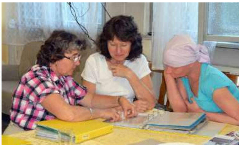
S farní archivářkou nad lhoteckými kronikami