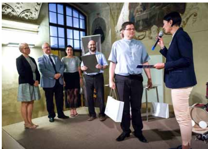
Vyhlášení vítěze kategorie „Máme vybráno“

Do hlasování a zejména do shánění dalších hlasů se zapojoval rostoucí počet lidí nejen z naší farnosti, ale zejména mimo ni. Někteří dokonce náš „boj“