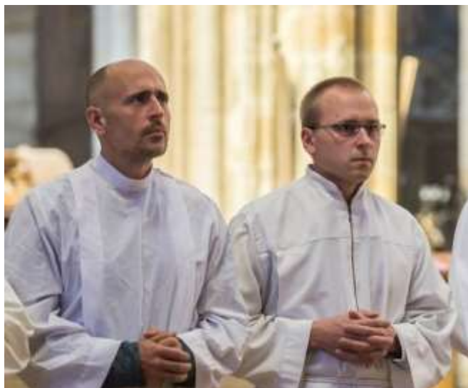
Dva budoucí jáhni v katedrále

Na gymnáziu jsem se pravidelně účastnil středoškolských atletických přeborů. Vzpomínám si na ty poslední okamžiky před startem, když jsem si jako sprinter upravoval startovací bloky a nakonec do nich zaklekl a čekal na výstřel. Byly to okamžiky plné napětí, ale i příjemně nervózního očekávání.