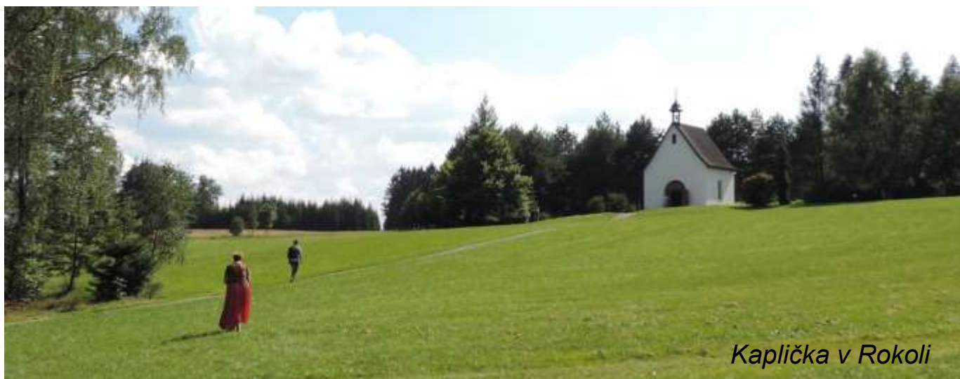
Kaplička v Rokoli