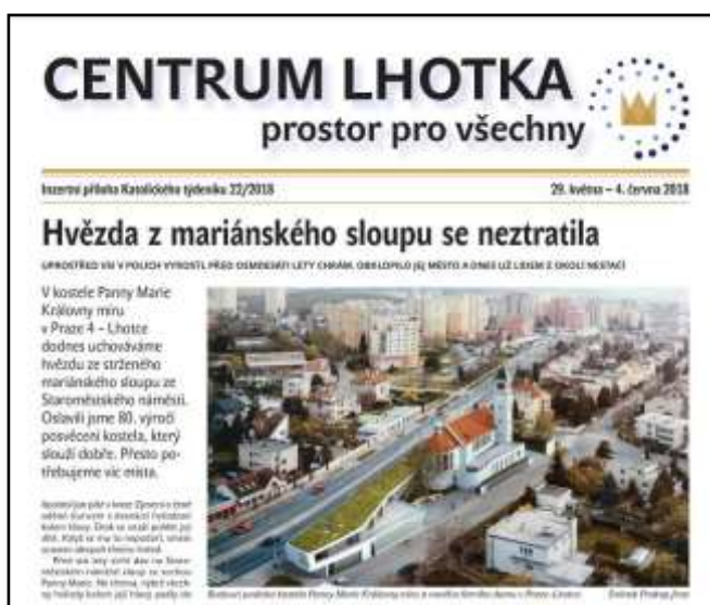
Příloha Katolického týdeníku č. 22

Když se v dubnu začal hlásit termín, kdosi mi připomněl mou koordinační roli, a taky jsem začala sbírat příspěvky. A už to začalo. Chybějí vhodné fotografie. Jaké tam vůbec chceme mít? Půlka jich je nekvalitní, jiné tam nemůžeme dát kvůli ochraně osobních údajů. Obsahy článků se nám kryjí. Nepůsobí výčty našich aktivit chvástavě? Máme publikovat fotky dezolátních míst v bytech kněží, nebo už je to moc? Každý měl na věc jiný názor a kartami nám ještě zamíchali v redakci Katolického týdeníku.