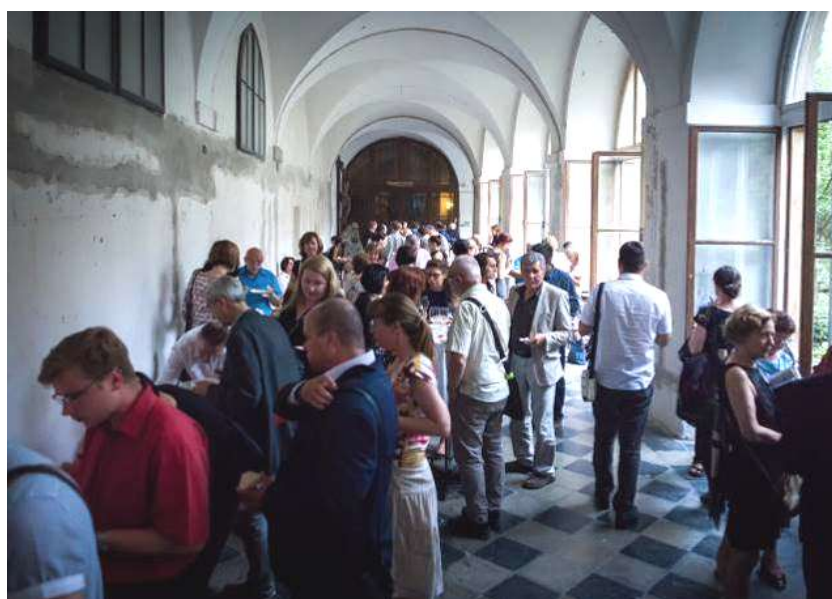
Občerstvení v ambitech