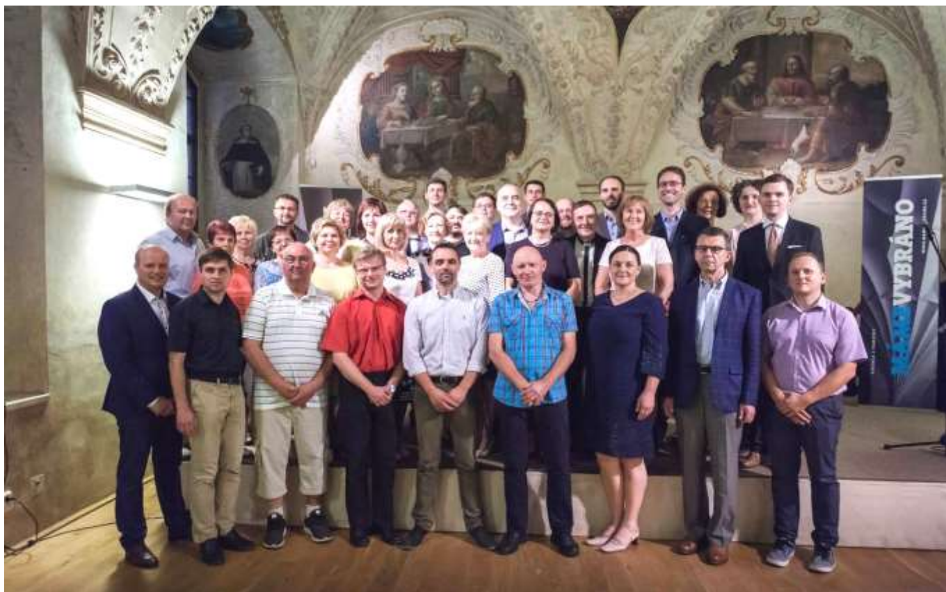
Společná fotka vítězů tří soutěžních kategorií pořádaných Institutem pro památky a kulturu