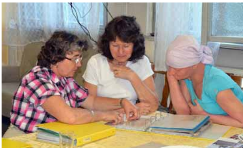
S farní archivářkou nad lhoteckými kronikami