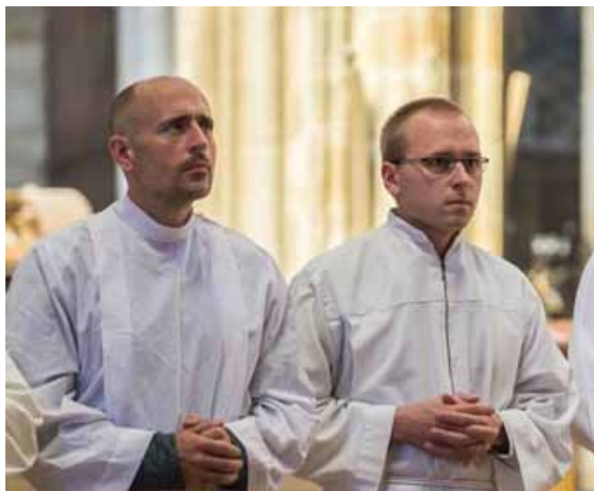
Dva budoucí jáhni v katedrále

Na gymnáziu jsem se pravidelně účastnil středoškolských atletických přeborů. Vzpomínám si na ty poslední okamžiky před startem, když jsem si jako sprinter upravoval startovací bloky a nakonec do nich zaklekl a čekal na výstřel. Byly to okamžiky plné napětí, ale i příjemně nervózního očekávání.