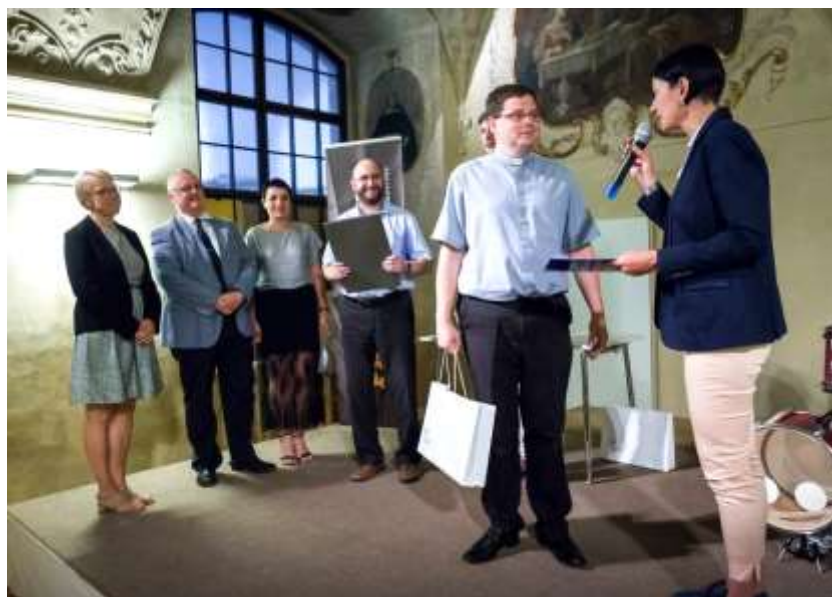
Vyhlášení vítěze kategorie „Máme vybráno“

Do hlasování a zejména do shánění dalších hlasů se zapojoval rostoucí počet lidí nejen z naší farnosti, ale zejména mimo ni. Někteří dokonce náš „boj“