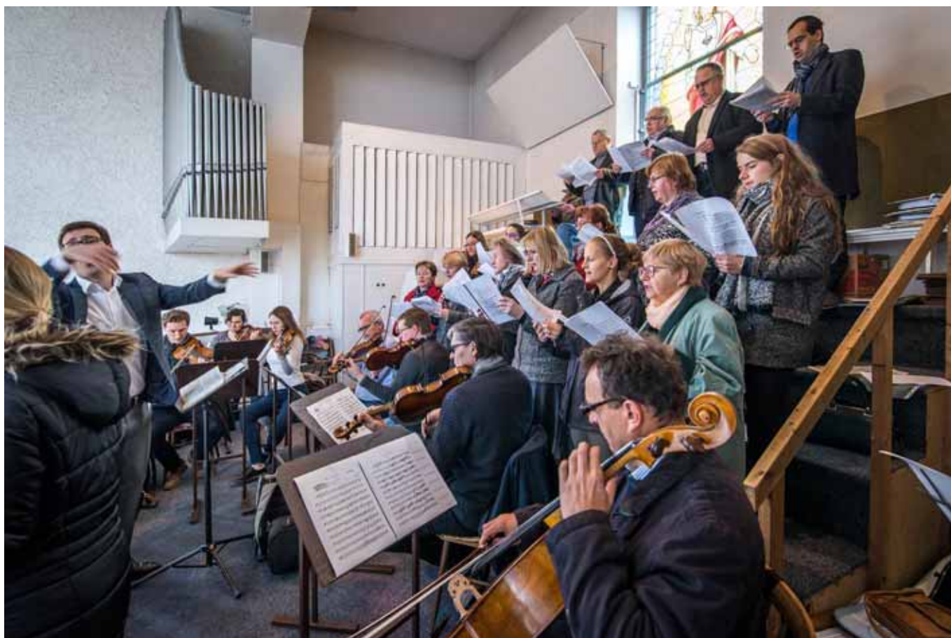
ze lhoteckého posvícení 2017