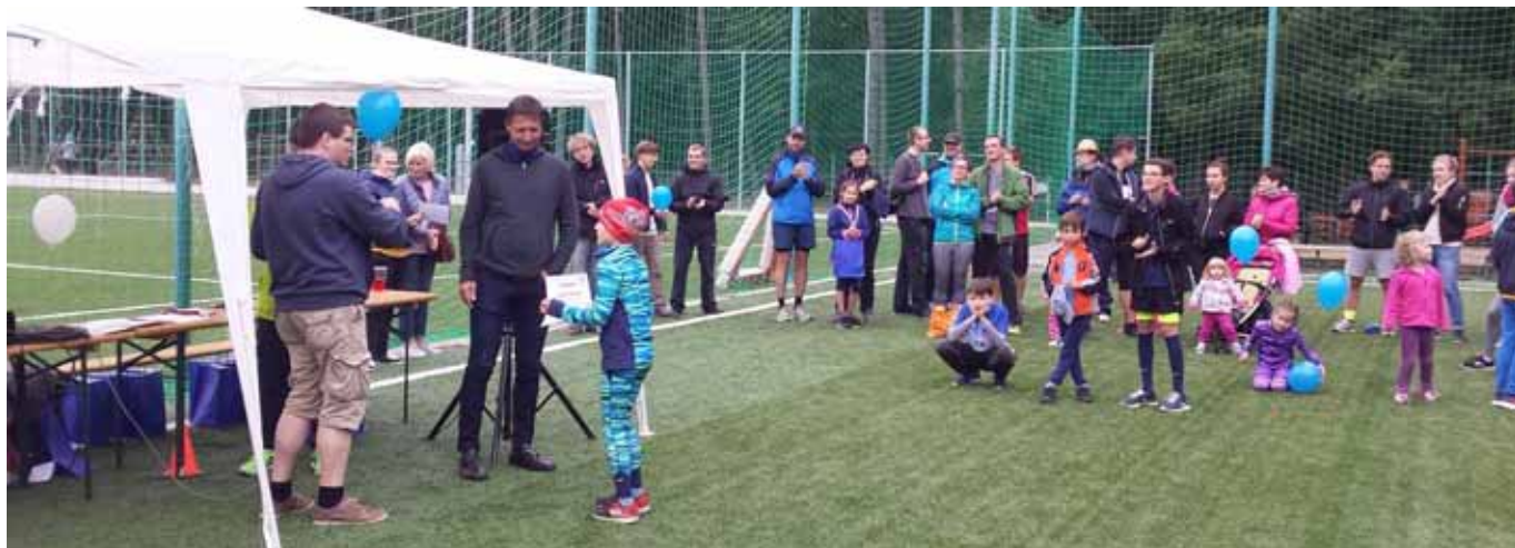
Foto z vyhlásování vítězů na 1. ročníku Lhoteckého běhu 2017