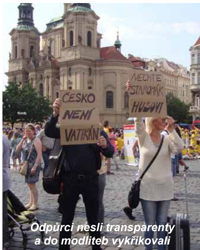
Odpůrci nesli transparenty a do modliteb vykřikovali

Nedělala jsem si o odpůrcích iluze, ale zdá se, že jejich zloba nepramení ani tak z odporu proti obnovení sloupu jako z nenávisti ke křesťanství a jeho hodnotám. Domnívám se, že základní