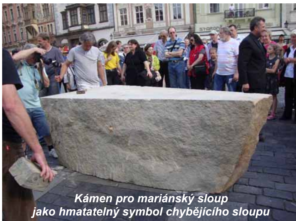
Kámen pro mariánský sloup jako hmatatelný symbol chybějícího sloupu