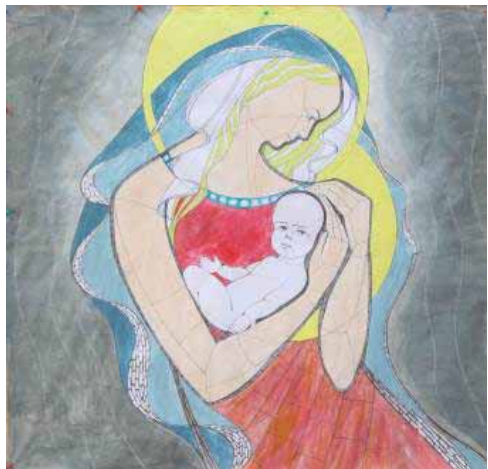
Pracovní návrh mozaiky na fasádu centra od sochaře Petra Váni