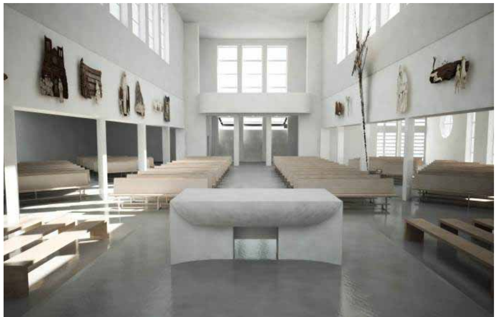
Vizualizace: Pohled od oltáře ke vstupu