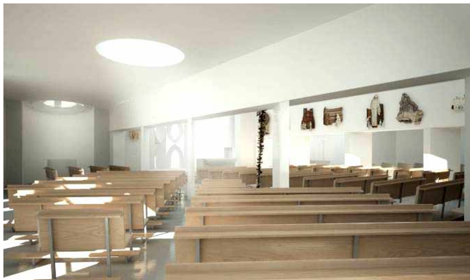
Vizualizace: Pohled z bývalé kaple Nejsv. Srdce Ježíšova do hlavní lodi

My na Lhotce vlastně máme takový model komunitního centra. Jenom ne nového, ale pěkně zchátralého