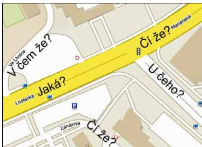
Naše ulice známé neznámé

Blízkost administrativních center a pronajímání bytů v rodinných domech stále zvyšují počet aut parkujících v naší kdysi klidné ulici. Jsou domky, které využijí i pět parkovacích míst. Naše rodina tam potřebuje vmáchnout jediné mrňavé autíčko, ale často marně. Vlekouce zpoza křižovatky nákup, hubuji na to, ale přes snahu vyjednávat se mi nepodařilo se se