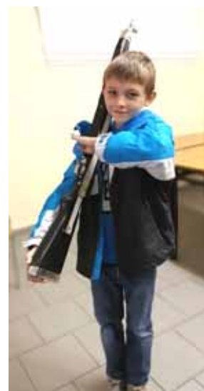
K počtě zbraň!