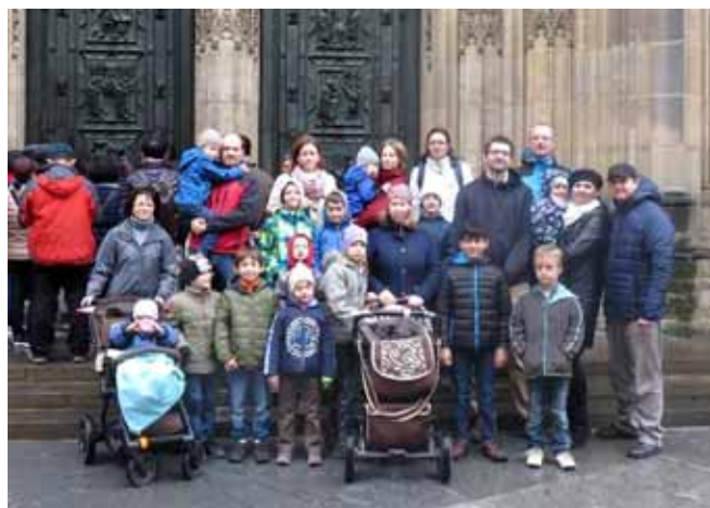
Společně před katedrálou