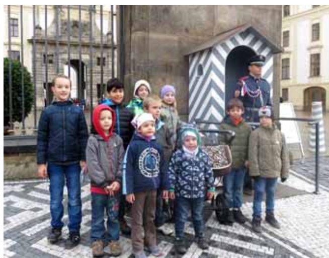
Výrazně posílená Hradní stráž