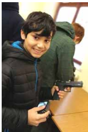
Vyfoť mě s pistolí