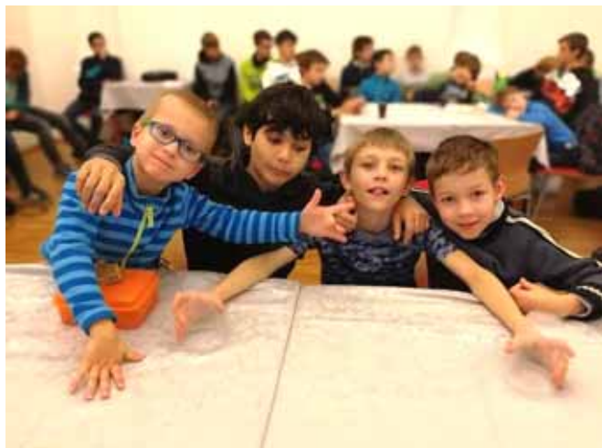
Naši veselí ministranti

krátké duchovní slovo a prezentaci života v konviktu a semináři místními bo-