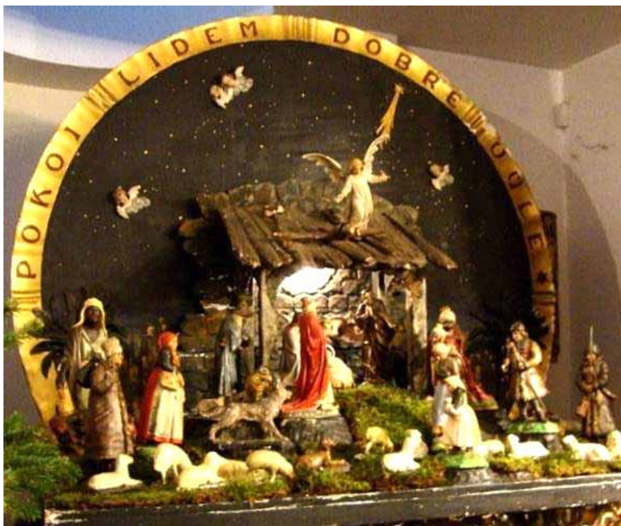
Původní lhotecký betlém před přidáním figurek z jiného betléma