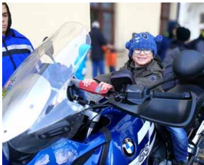
Na motorce Hradní stráže

Po obědě jsme byli pozváni do vojenského kostela sv. Jana Nepomuckého, kde nám zahrál orchestr Hradní stráže několik hudebních ukázek. Kostel kdysi patřil k vedlejšímu klášteru Voršilek a nyní je propůjčen Armádě ČR k užívání. Z bývalého kláštera jsou dnes kasárna, do kterých jsme mohli též nahlédnout. Zde si obzvláště kluci přišli na své. Vojáci nám předvedli výcvik služebních psů, služební motorky, na které bylo možné nasednout a vyzkoušet si je, a nakonec i svou vojenskou výzbroj včetně šavlí, pistolí, samopalů nebo ostřelovací pušky.