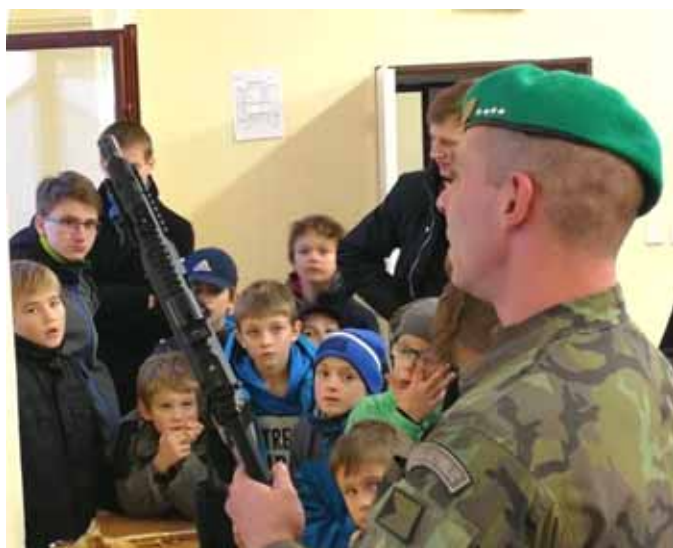
Ukázka zbraní Hradní stráže