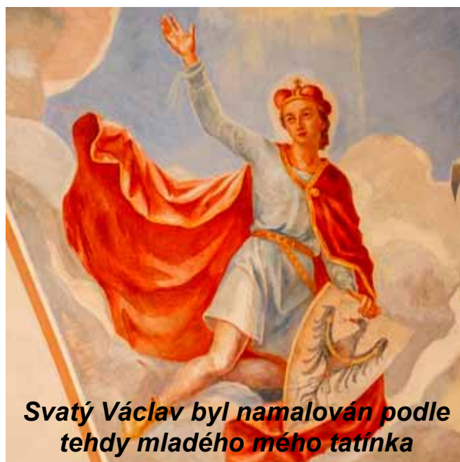
Svatý Václav byl namalován podle tehdy mladého mého tatínka

krajiny. Bylo těsně před 15. hodinou a právě měla začít mše. To jsme předem nevěděli. Tak nám Bůh otevřel dveře svého domu. Sešlo se nás tam jen několik. Kněz nás pěkně přivítal. Žalm „Hospodine, tvá dobrota trvá na věky“ mě v této situaci hluboce oslovil a též homilie na Matoušovo evangelium 16,13-20 na téma „Kým je pro nás Bůh“. Kdysi jsem také v tomto kostele