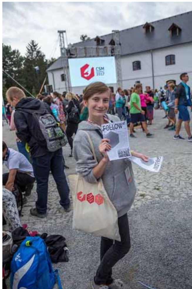
Úžasný časopis Follow

Ale všechny tyto zážitky nejsou jediným pozitivem, které přípravný tým přináší! Měli jsme také třeba teplé večere, pořádné porce jídla (možná až moc), dostali jsme cool týmová trička, spali jsme na posteli... Teda ne že bychom nějak moc spali, to zase ne.