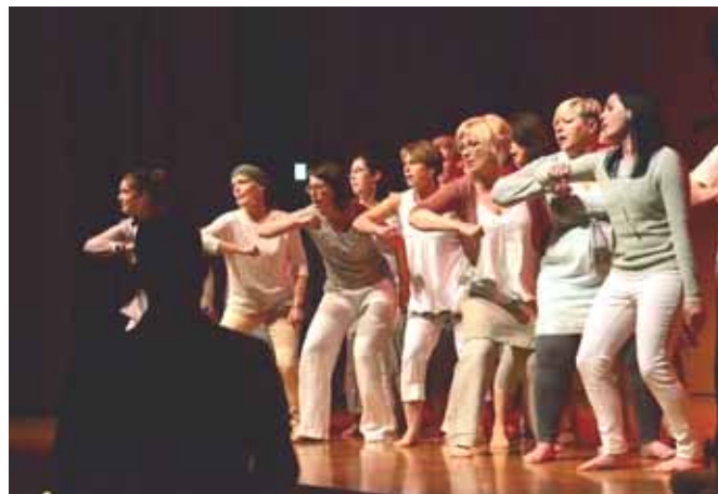
Singallinas v akci

V neděli 15. října 2017 budou zpívat sinGALLinas při mši svaté v 10 hodin v kostele Na Lhotce!