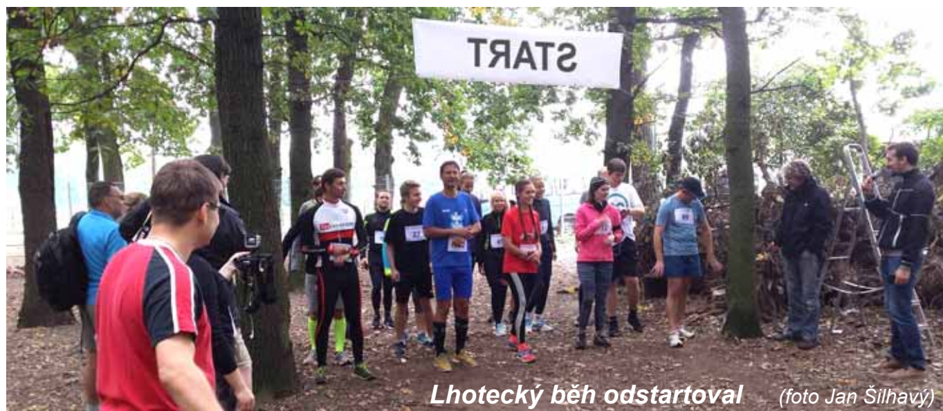
Lhotecký běh odstartoval

Že si vlastně ani neuvědomím, že je zde kromě mne i můj Bůh. Znamená to, že takový den je ztracený? Námaha naprosto zbytečná? Naštěstí Bůh se na naše snažení dívá jinak, nezávisle na našich pocitech. Důležitá je právě ta snaha. Nicméně i s takovým „mizerným“ dnem je potřeba se nějak vyrovnat. Je potřeba ho večer nějak uzavřít, zkompletovat a – to nejdůležitější – odevzdat Pánu. Se vším všudy, s nezday, pocity marnosti, křivdami i hříchy. Jedině on může napravit to, co jsme opravdu pokazili, doplnit, co chybí, a všemu dát hodnotu věčnosti. Poprosit – poděkovat – odevzdat. Myslím, že pak těch opravdu „špatných“ dnů bude jen velmi málo. sr. Bernarda