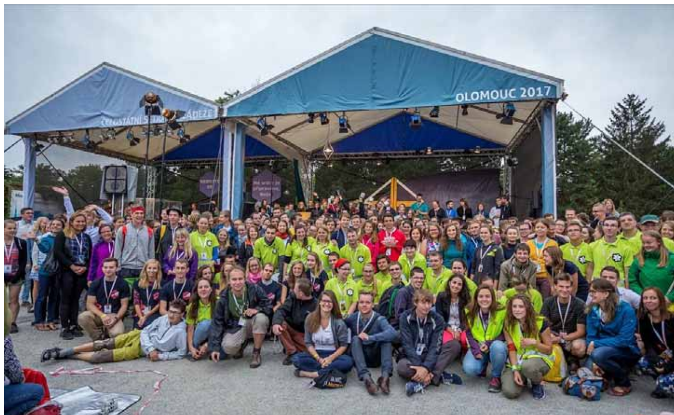
Přípravný tým setkání mládeže v Olomouci čítal okolo 700 mladých lidí