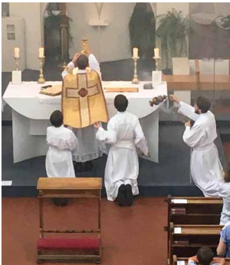
Pozdvihování při tzv. tridentské mši