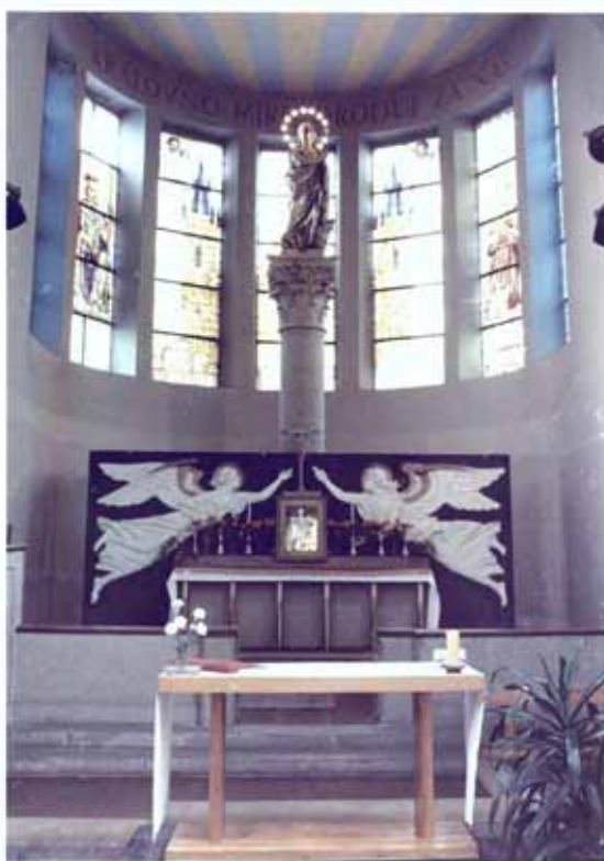
Interiér lhoteckého kostela z roku 1969