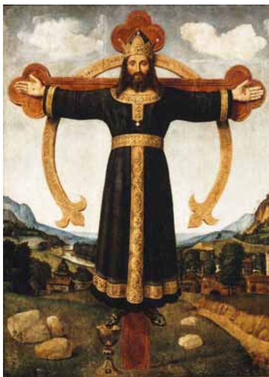
Piero di Cosimo, obraz krucifixu Volto Santo, 16. stol.