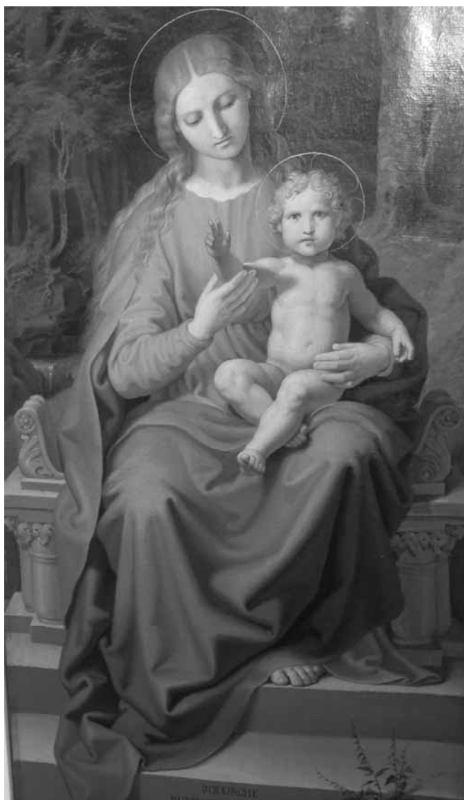
Madona s Ježíškem od Josefa Führicha, oltářní obraz v kostele sv. Vavřince v Chrastavě