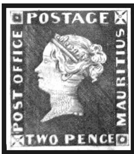
Modrý Mauritius, jedna z nejcennějších známek světa