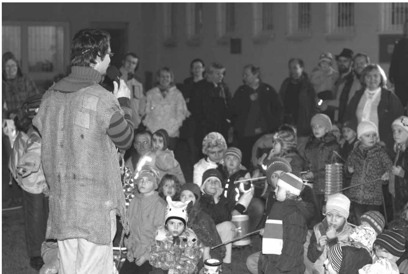
Děti napjatě sledovaly příběh o svatém Martinovi

Slovo „archetyp“ pochází z řeckých slov arche-typos a značí první vzor, například pro ražbu mincí. Jedná se o pravzor, tradici posvěcenou a typickou postavu, představu, či příběh. Takovým archetypem lidskosti a milosrdenství, který nám může být blízký, je postava sv. Martina, jehož svátek si připomínáme 11. listopadu.