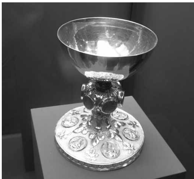
Kalich sv. Wolfganga, Řezno 12. stol.