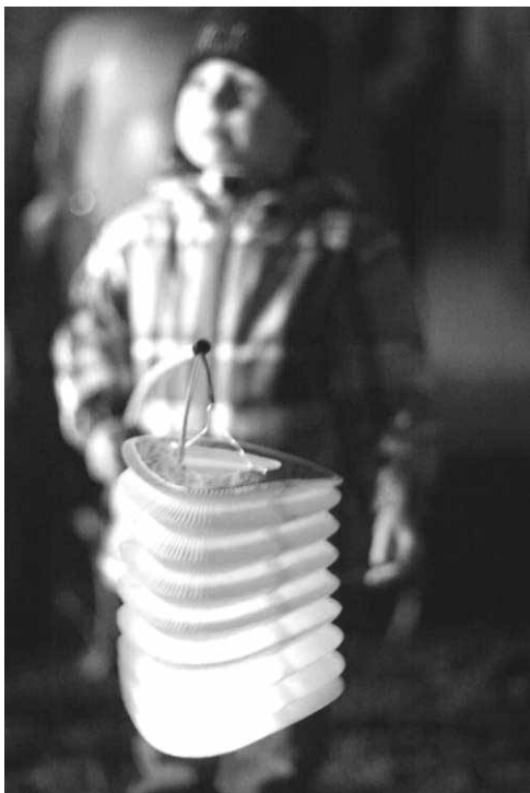
V průvodu se zářícím lampiónem